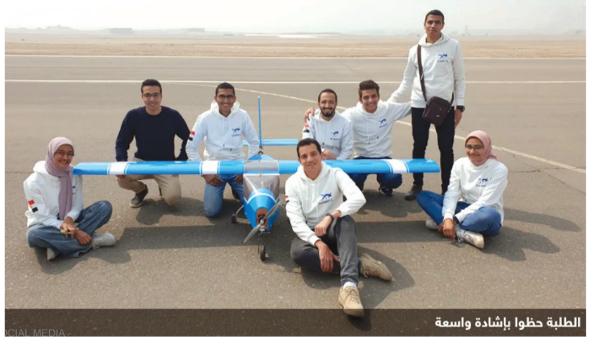
الطلبة حظوا بإشادة واسعة