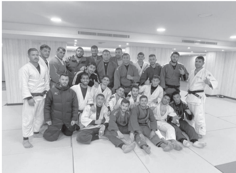
إعداد اللجنة الإعلامية لاتحاد الإعلام الرياضي