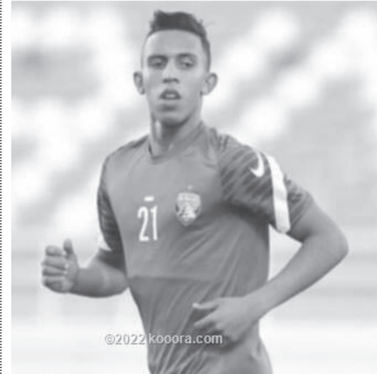
ابو ظبي - وكالات

تتميزه مؤثرة. وحل في المركز الثاني في لائحة صناعة الأهداف، ضياء سبع، لاعب النصر، حيث صنع 6 أهداف، وسجل 8 أخرى. وقدم سبع تمريرة صحيحة، وقام بـ 48 مراوغة، بنسبة نجاح 68.75%. وقام بـ 31 تمريرة مؤثرة. وجاء في المركز الثالث نيكولاس خمينيز، لاعب بني ياس، بـ 6 تمريرات حاسمة، بينما سجل 5 أهداف، وقام خمينيز بـ 32 تمريرة مؤثرة، ومرر 490 تمريرة صحيحة، بالإضافة إلى 69 مراوغة بنسبة نجاح 68.12%.