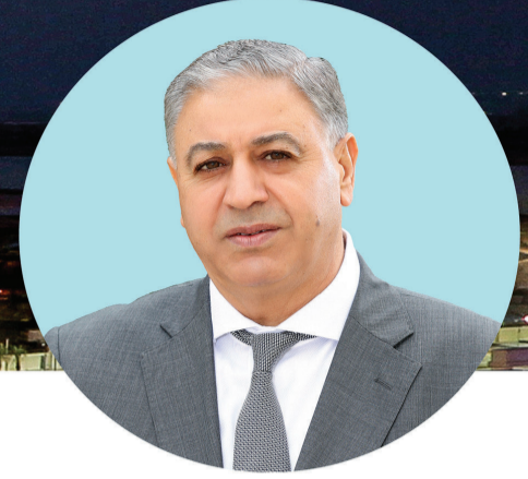
حضرات المساهمين الكرام،