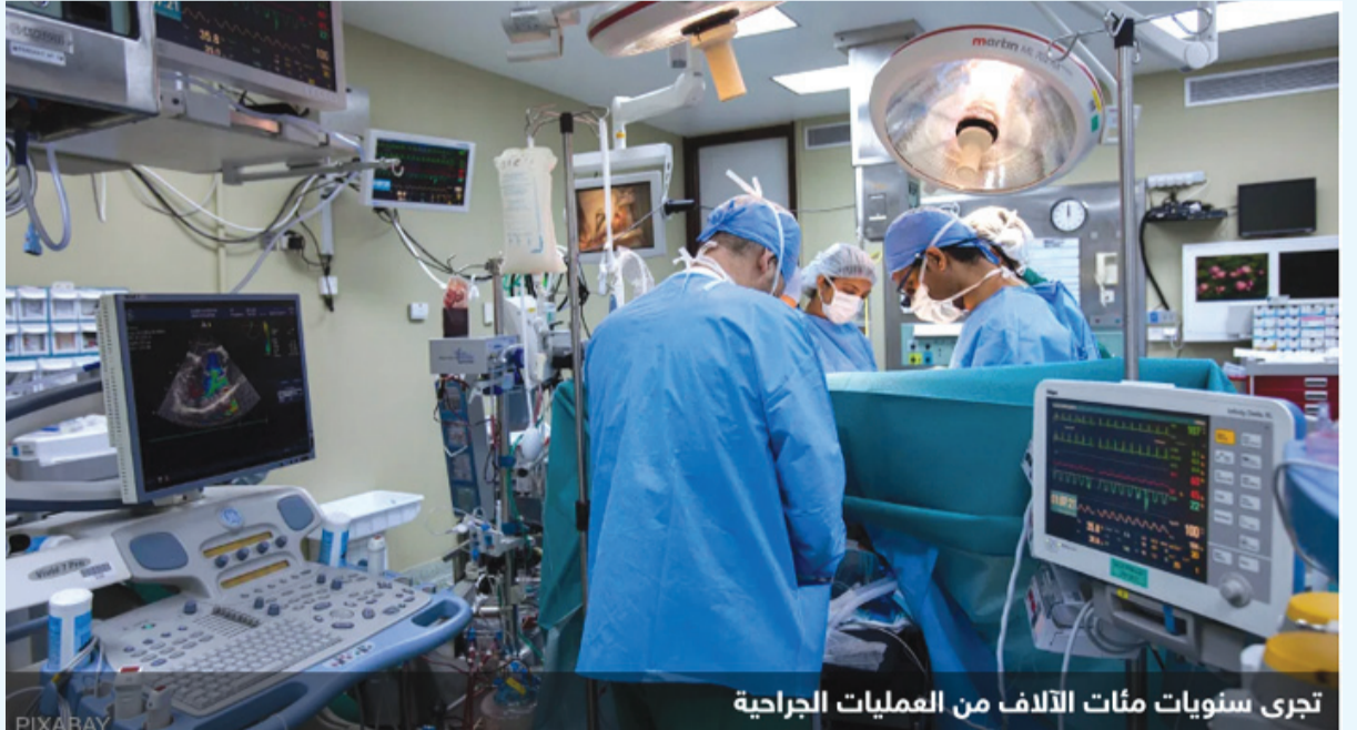
تجرى سنويًا مئات الآلاف من العمليات الجراحية