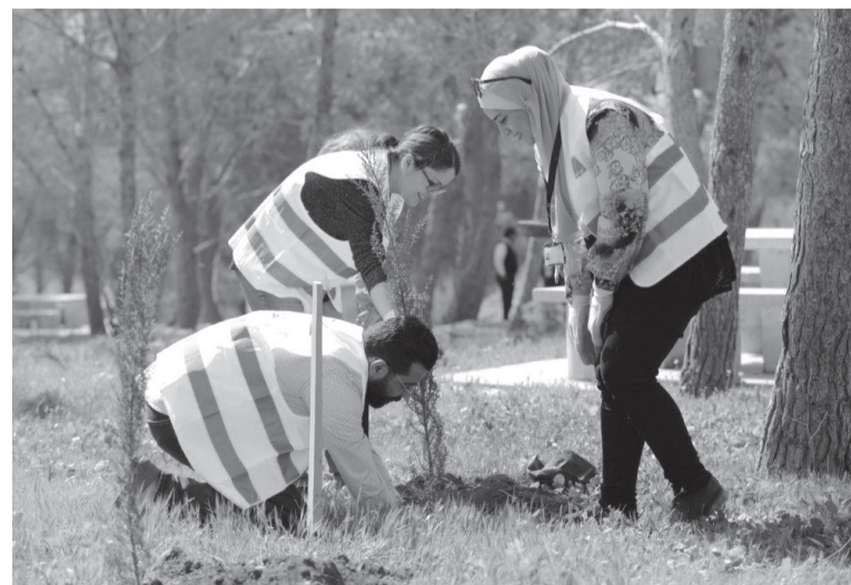
وأكدت نائب المدير التنفيذي للعلاقات العامة، المسؤولية الاجتماعية والاتصال

2025، وتخفيضها إلى الصفر بحلول العام 2040.