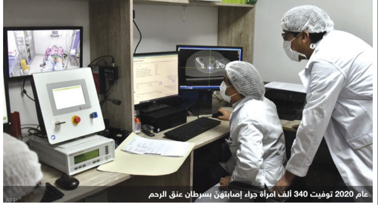
عام 2020 توفيت 340 ألف امرأة جراء إصابتهن بسرطان عنق الرحم

وبحسب كرافيو توتو رئيس لجنة الخبراء التابعة لمنظمة الصحة العالمية، فإن "مرأة واحدة تموت كل دقيقتين تقريبا بسبب إصابتها بهذا المرض"، وفقا لـ "فرانس برس". وسُجّلت نحو تسعين في المئة من الإصابات والوفيات الحديثة عام 2020 في البلدان المنخفضة والمتوسطة الدخل.