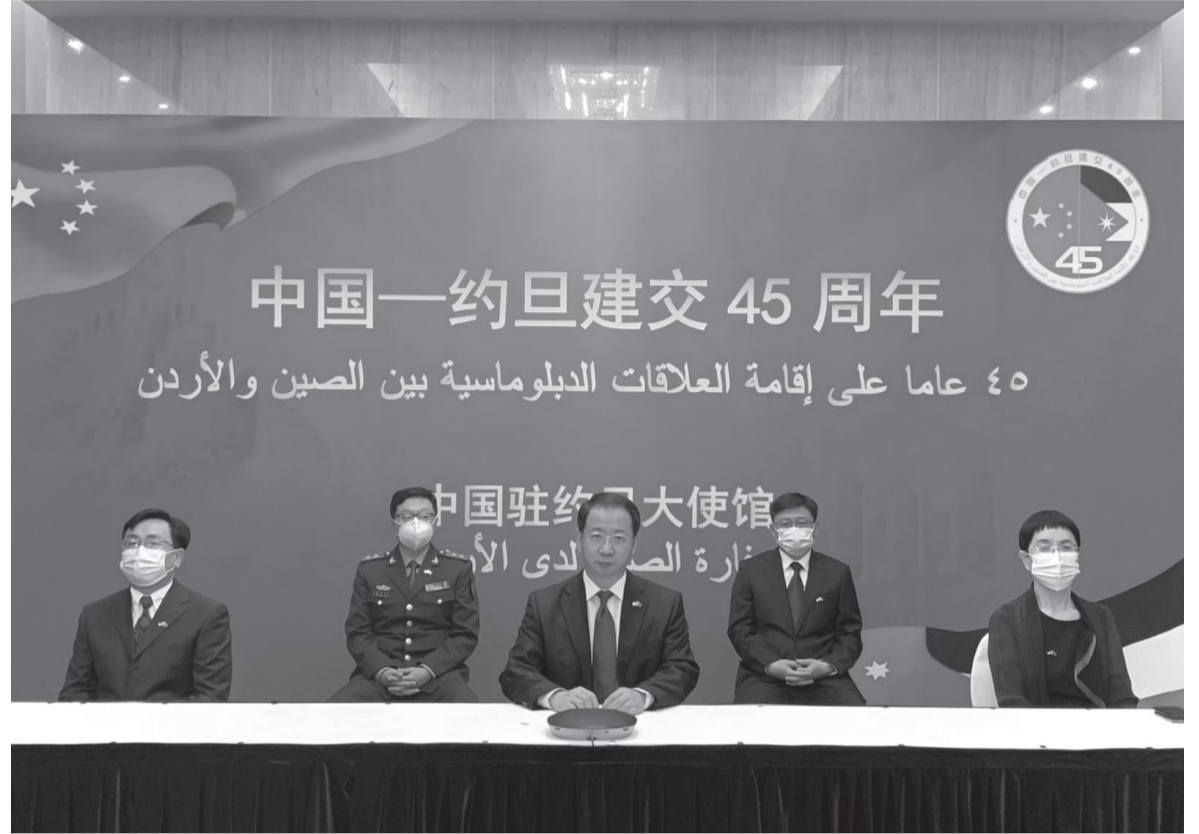
الانباط- نعمت الخورة

مرة مقارنة بما كانت عليه في بداية العلاقات الدبلوماسية بينهما .