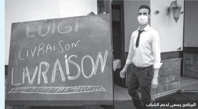
البرنامج يسعى لدعم الشباب

ينجح ظاهرياً، لكن عملياً قد يكون ذلك صعب التحقيق. واستطرد قائلا في سياق إبرازه لمميزات البرنامج: "جميل أن يستفيد كل الشباب بدون تحديد مستوى تعليمي معين في إطار مبدأ تكافؤ الفرص، لكن هل هم فعلاً قادرين على تدبير مشاريع خاصة؟"