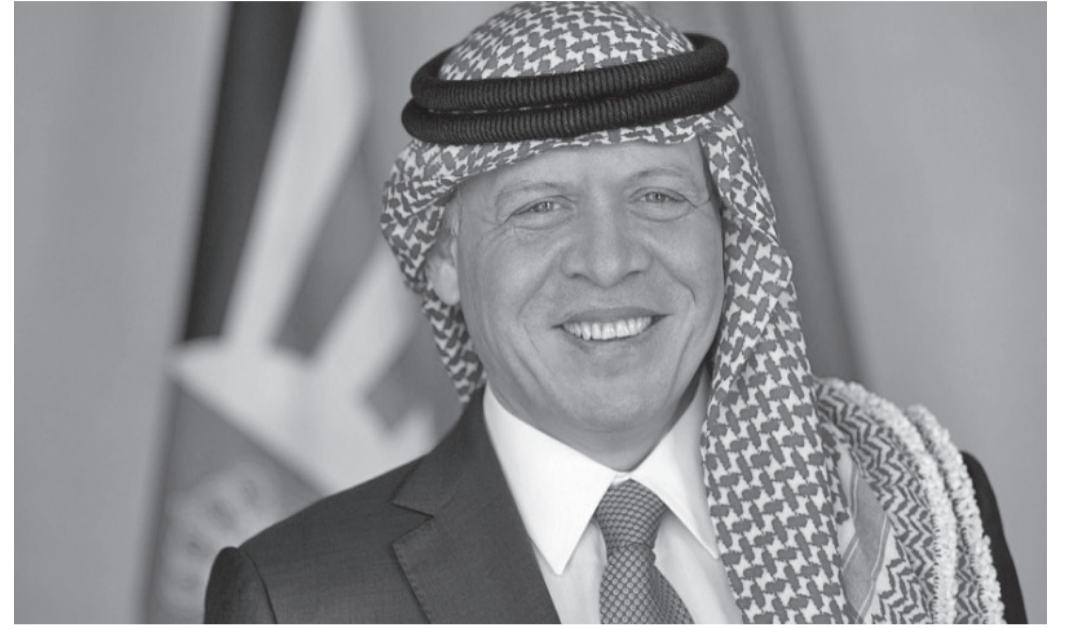
الانباط-عمان أكد جلالة الملك عبدالله الثاني والرئيس الأمريكي جو بايدن التزام المملكة الأردنية الهاشمية والولايات المتحدة الأمريكية بمواصلة العمل من أجل تحقيق السلام في المنطقة والعالم.