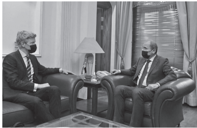
الانباط-عمان إلى المرجحيات العتمة وبما يفضي إلى إنهاء الأزمة ويضمن وحدة اليمن الشقيق وسلامة أراضيه. وضمن الصفدي الجهود الكبيرة التي

بحث نائب رئيس الوزراء ووزير الخارجية وشؤون المغتربين خلال لقائه، امس الاثنين في مقر الوزارة، المبعوث الخاص للأمن العام للأمم المتحدة إلى اليمن هانس غرونديبرغ، آخر المستجندات في اليمن، والجهود الأهمية لإنهاء الأزمة عبر حل سياسي يعيد لليمن الشقيق أمنه واستقراره، ويرفع المعاناة عن شعبه الشقيق ويُلبي تطلعاته في الأمن والسلام. ورحب الصفدي بالهدنة التي أعلنت عنها الأمم المتحدة لمدة شهرين في اليمن، والتي بدأت في مطلع شهر نيسان، مؤكداً دعم اللجنة للجهود والماسعي الأهمية لحل الأزمة اليمنية واستمرار المملكة في إسناد البعثة الأهمية لليمن التي تتخذ من عمان مقراً لها، مشدداً على أهمية تكثيف العمل للتوصل إلى حل سياسي يستند