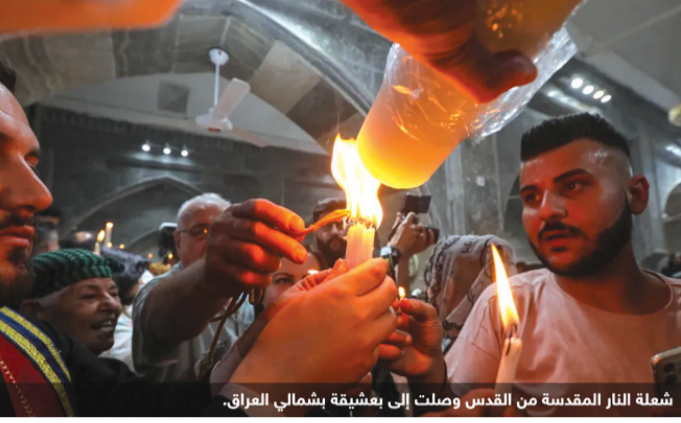
شعلة النار المقدسة من القدس وصلت إلى بعشقة شمالي العراق.