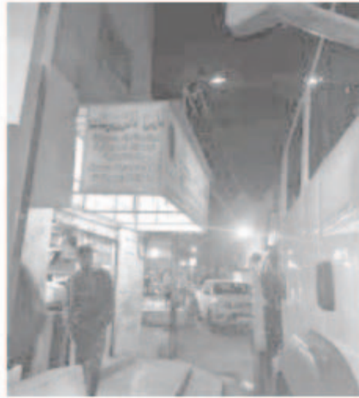
القراوي، البلدية تدفع منذ زمن لكن

عرعر: لجنة الشؤون الفلسطينية غير قادرة على تغطية المبلغ المطلوب