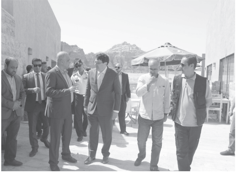
الانباط - العقبة

وتحويل العقبة الى وجهة متميزة للأبحاث الدولية في الطرف الشمالي لخليج العقبة.