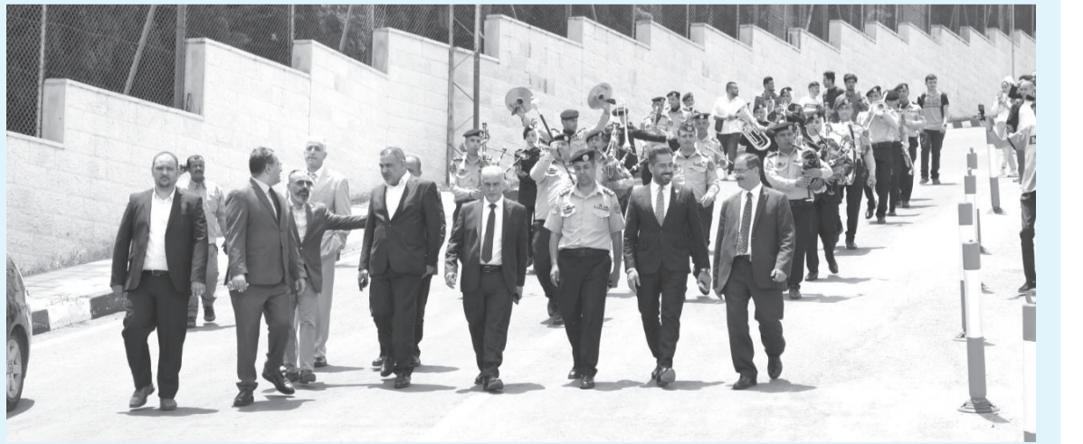
الانتباط - عمان

تحت عنوان «وتستمر المسيرة الأردنية الهاشمية»، والتي تعبر عن مئوية الدولة الأردنية منذ أن تم إطلاق الرصاصات الأولى وعهد الملك عبدالله المؤسس، وتأسيس إمارة شرق الأردن وصدور الدستور الأردني وعهد الملك الحسين الباني وعهد جلالة الملك عبدالله الثاني بن الحسين «المعزز»، وما شهدته هذه