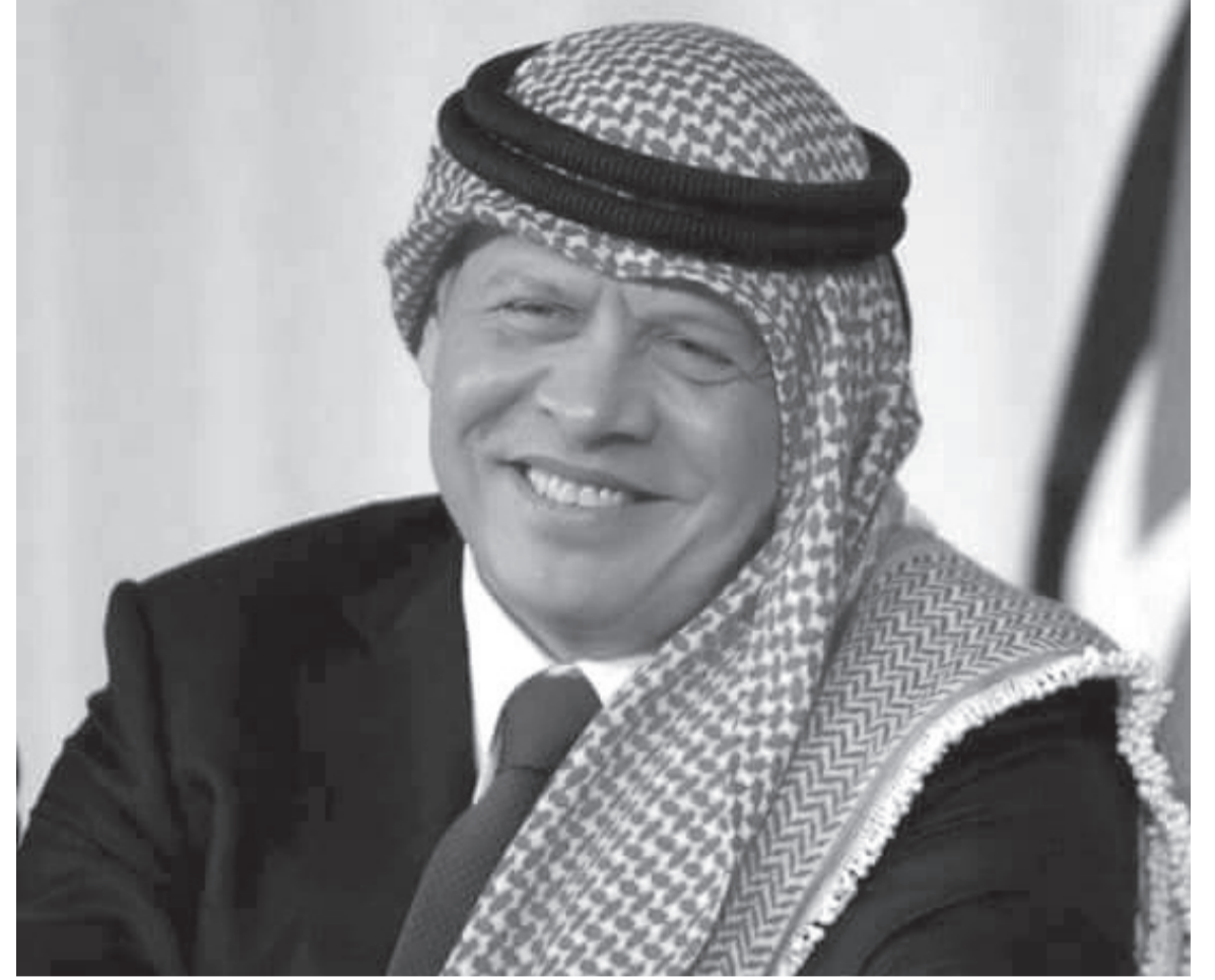
الانتباط - عمان

وخلال الفترة بين 1961 وقيبل حرب حزيران 1967، وبعد أن تجاوز الأردن فترة