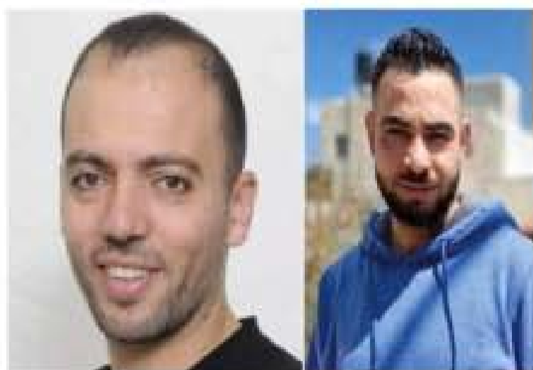
اليوم الـ ١٠٠ من الاعتقال الإداري، ووالد ريان (١٧ عاماً) من القدس يستلم اليوم ١٠٠ رفضاً ٢٠٠٠ رسالة احتجاجية من أهله وأقربائه، وهدية هبة شؤون الأسرى والمحررين.

من تمهيداً الحاشية الصحفية لتأسيس الضرب عن الطعام والد ريان والأسير عاودة، من بلدة إيتا غرب مدينة الخليل، يواجه وضعاً صحياً خطيراً، وتشهدت هذه المصعوبة مع مرور الوقت، ومع رفض الاعتقال عن السلطة القضائية بطلب، وإنهاء اعتقاله الإداري.