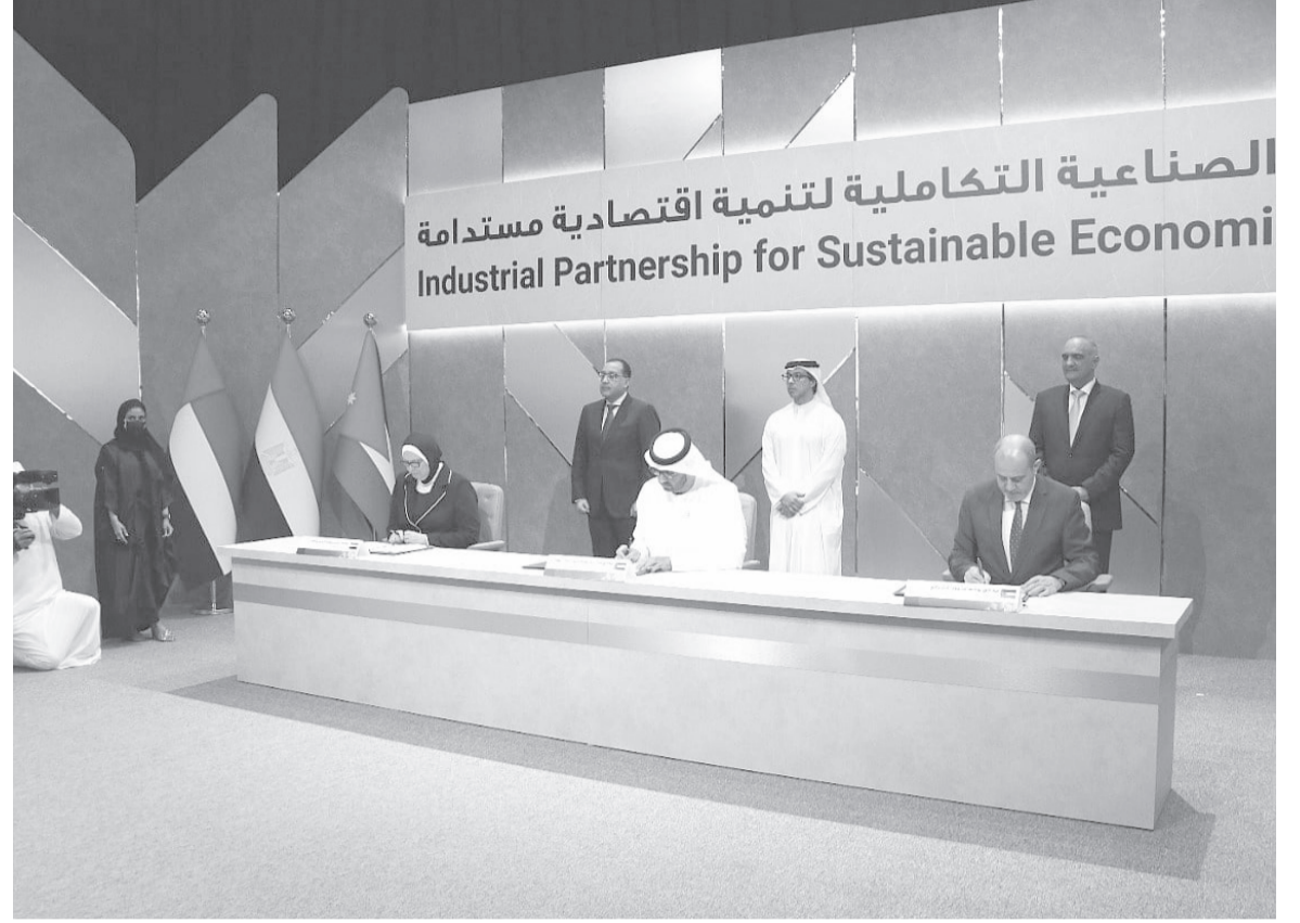
الانباط- أبو ظبي

المشتركة ستسهم في توثيق علاقات الأخوة والتعاون مع الأشقاء في كل من المملكة الأردنية الهاشمية وجمهورية مصر العربية، كما ستسهم هذه الشراكة الصناعية التكاملية في تنويع الاقتصاد وتعزيز نموه في دولنا من خلال زيادة القيمة المضافة للمنتجات الصناعية، خاصة في المجالات ذات الأولوية، مثل البتروكيماويات، والأدوية، والزراعة والأغذية، وغيرها، مؤكدا أننا ومن خلال التكامل بين الخبرات والموارد، سنكون قادرين على إضافة قيمة صناعية وخفض تكاليف الإنتاج، وتوفير المزيد من فرص العمل، وتحقيق الخير للجميع.