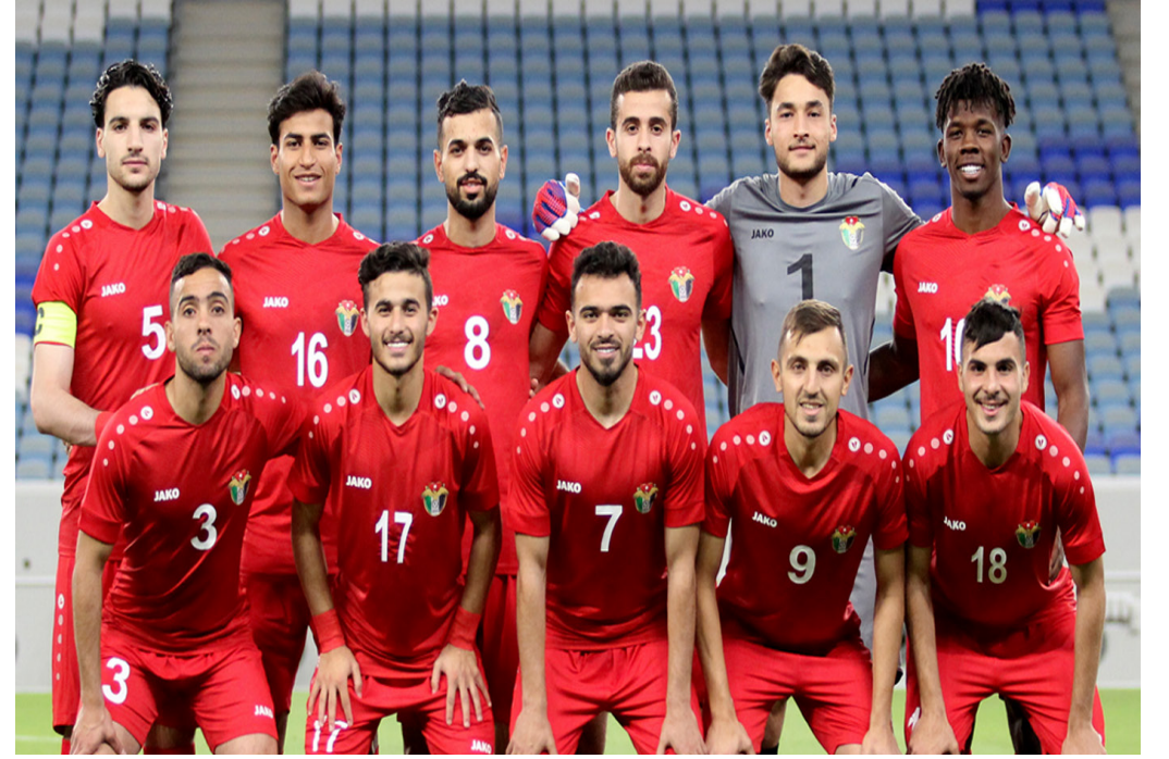
الانباط - عمان يخوض منتخبنا الوطني لكرة القدم تحت ٢٣ عاما