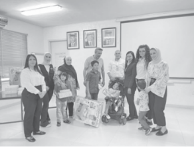
الانباط - العتبة

ريجيني سي لزجج البسة على وجوه الأطفال الأيتام وذوي الاحتياجات الخاصة في محافظة العقبة ولنؤكدهم لهم أهدم جزء أصيل من هذا المجتمع وأنا نفق إلى جانبهم وندهمهم ليكونوا مواطنين فاعلين لهم بصمات إيجابية في بناء مستقبل مشرق لنا جميعاً، مشيراً إلى أن أيلة تولي الجانب الاجتماعي والإنساني أهمية قصوى وتوسعي من خلال تنفيذ العديد من المبادرات إلى المساهمة في تنمية المجتمعات التي تعمل بها. من جانبه، أعرب المدير العام لفندق ومنتجع حياة ريجيني سي أيلة العقبة، جون فرانسوا دوراند، عن سعادته بمشاركة الفندق بهذه الفعالية التي رسمت البسمة على وجوه الأطفال وأسهمت ولو بشكل بسيط في تعويضهم عما فقدوه من حنان الأم والأب، مبيناً أن مثل هذه المبادرات تعمل على تعزيز روح العطاء والالتزام لدى هؤلاء الأطفال وتساعدهم على متابعة مسيرة تعليمهم وتلقي حاجاتهم النفسية والصحية ليكون لهم دور فاعل في المستقبل.