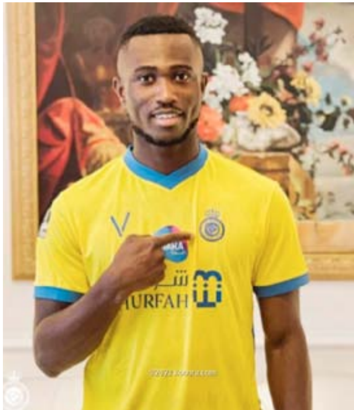
الرياض - وكالات

معمّر رئيس النادي. وكان كونان قد أتم قبل أيام، موسمه السادس في الملاعب الأوروبية، حيث لعب إجمالي ١٤٠ مباراة في الدوري البرتغالي مع فيتوريا، والدوري الفرنسي مع ستاد ريمس. وأصبح كونان لاعباً أساسياً في تشكيلة منتخب كوت ديفوار في بداية العام الجاري، واستمرت القيمة السوقية للاعب في تصاعد حتى وصلت إلى ٧ ملايين يورو، في آخر تحديث لوقع ترانسفير ماركيت.