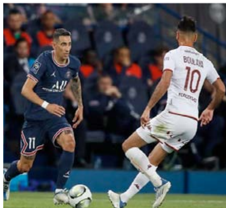
روما - وكالات

أن يتم الإعلان عن انضمامه بشكل رسمي للسيدة العجوز خلال نفس اليوم. وأشار الموقع إلى أن أنخيل سويغ على عقد لمدة عام واحد فقط مع يوفنتوس، فيما سيحصل على ٧ ملايين يورو كراتب في الموسم. ولفت إلى أنه بداية من يوم الإثنين المقبل، سيبدأ دي ماريا بالنزول لأرض ملعب تدريبات اليو في كوتينا، ليشترك في أول حصص تدريبية مع فريقه الجديد وتحت قيادة ماسيميليانو أليجيري المدير الفني للسيدة العجوز.