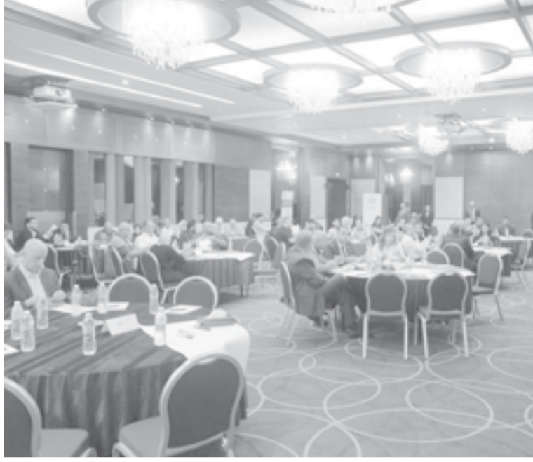
النباط - خليل النظامي

حديث ل مدة دقائق معدودة دار بيني وبين وزير العمل نايف استيتيه على هامس الجلسة الحوارية التي نظمتها وزارة العمل حول واقع وفرص سوق العمل، تطرقت فيه للتساؤل حول أسباب إقامه هذه الورشة إن كانت بداية ل مبادرة جديدة من قبل الوزارة، أو مجرد ورشة كما الكثير من الورش التي تنظمها بعض المؤسسات الحكومية والخاصة بهدف الاضاعات الاعلامية وكسب الشعبية.