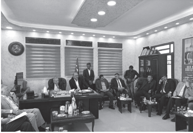
الانباط - مادبا

أكد نائب رئيس الوزراء وزير الإدارة المحلية، توفيق كريشان، أهمية دور البلديات في تعميق وتعميم التنمية المحلية في مختلف محافظات المملكة، بالتعاون والشراكة مع القطاع الخاص، إضافة إلى توسيع نطاق الخدمات التي تقدمها البلديات للمواطنين.