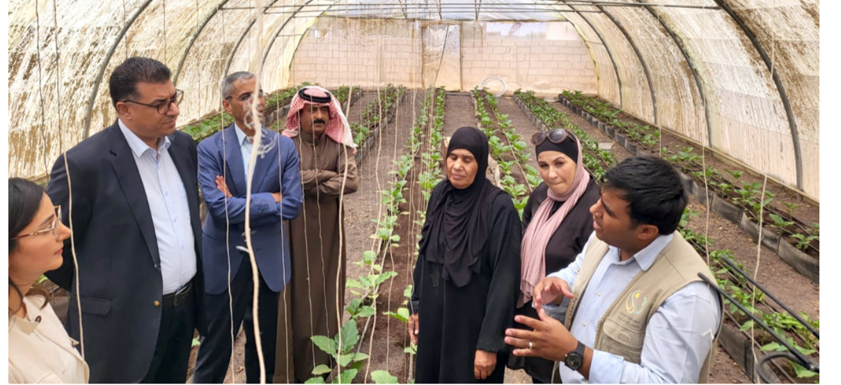
الانباط - المفرق

حيث تابع سير العمل في مشروع زراعات مائية تنتج نبات الازولا العلفي وهذه المشاريع تعمل وفق منظومة الصحراء الذكية في استخدام تقنيات وتكنولوجيا الحياة والحصاد المائي والذي يهدف إلى مساعدة المزارعين في التكيف مع التغيرات المناخية. وتنفذ الحنفيات أيضا مشروع صناعات