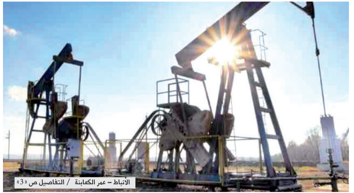
الأنباط - عمر الكعابنة / التفاصيل ص «3»