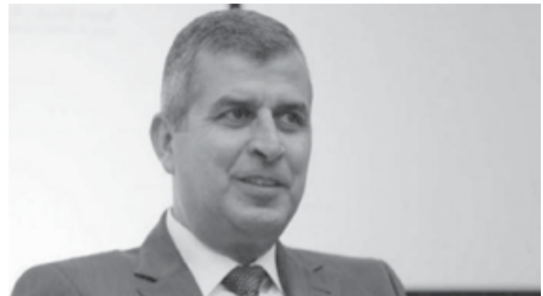
عمر الكعابة - الأنباط

إلا أن هذه البشري مر على موعد الإعلان عنها أكثر من شهر ولم يتم الإعلان عن موعد التنقيب حتى هذه اللحظة. المدير بالموضوع أن رئيس الوزراء بشر الخصاونة كان قد صرح سابقاً تحت قبة البرلمان أنه قد يكون لدينا مشورات وأعدة لشواهد قد تقضي إلى استكشافات لموارد طبيعية لدى بعض الدول النفطية، لكننا لا نعلم هل يقصد بهذه الموارد الطبيعية حقل السرحان أم الذهب أم النحاس أم السيليكا أم المعادن النادرة أم اليوتاس