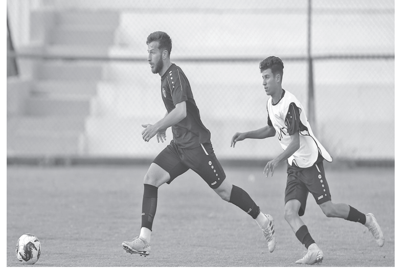
الانبات - عمان يخوض منتخبنا الوطني لكرة القدم

لشباب مباراة مهمة في الساعة الثالثة من مساء اليوم الأحد أمام منتخب فلسطين على ملعب نادي ضمك في الدور ربع النهائي من بطولة كأس العرب تحت 20 بهدف تحقيق الفوز ومواصلة مشواره بالمنافسة على لقب البطولة. وكان منتخبنا قد أنهى يوم امس اخر استعداداته للمباراة وأجرى المنتخب تدريبيه على ملعب نادي جرش، بقيادة المدرب إسلام ذيابات، حيث ركز الجهاز الفني على تمارين بدنية وتكتيكية بالشقين الدفاعي والهجومى. وكان المنتخب أنهى دور المجموعات متصدراً لمجموعته برصيد 4 نقاط، فيما حل اليمن وصيفاً بـ 3 نقاط، وأخيراً الإمارات (نقطة) وبدأ مشوار المنتخب، بالتعادل في افتتاح مبارياته أمام الإمارات 1-1، قبل الفوز على اليمن 0-1. في المقابل، جاء