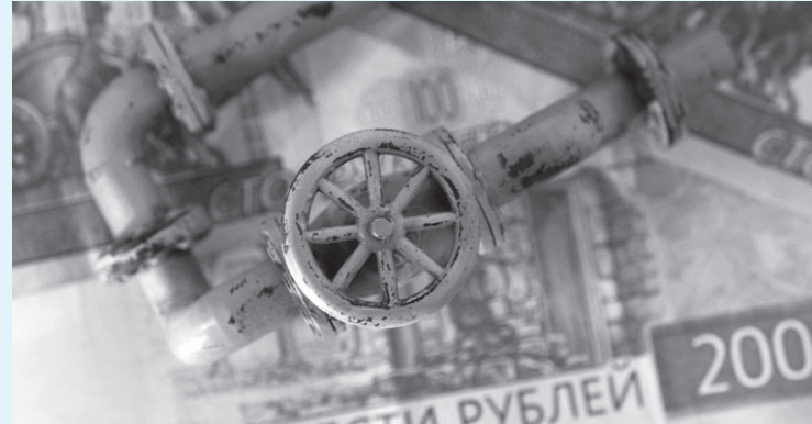
نقب البلد- وكالات

وكانت «غازبروم» وكانت شحنتا الغاز إلى أوروبا عبر خط أنابيب «نورد ستريم 1» يوم الأربعاء الماضي إلى حوالي 20 بالمئة فقط من طاقتها.