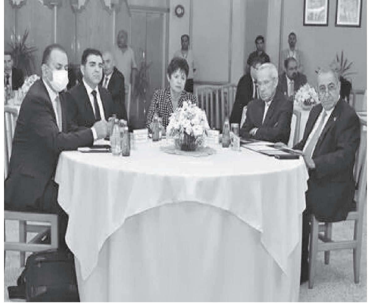
الانباط - الرمثا

مندوبية عن سمو الأميرة منى الحسين، رعت مستشارتها للصحة وتنمية المجتمع الدكتورة رويدا المعاطبة، انطلاق فعاليات أعمال المؤتمر العلمي بعنوان "الرعاية الصحية الأولية والرفاه الصحي"، ورؤية التحديات الاقتصادية 2023، والذي نظمتها جامعة العلوم والتكنولوجيا. وناقش المؤتمر الذي شارك فيه خبراء في مجال الرعاية الصحية الأولية والرفاه الصحي، مواضيع متعلقة بالتحول للرعاية الصحية الأولية، والتأمين الصحي الشامل، وتحسين جودة الخدمات الصحية. وقال رئيس الجامعة الدكتور خالد السالم إن ما تضمنته الرؤية من مخرجات كانت نتيجة مناقشات لورش العمل الاقتصادية الوطنية التي عقدت في الديوان الملكي الهاشمي بناءً على توجيهات من جلالة الملك عبدالله الثاني، خاصة التأكيد على تمتع الأردن بقطاع رعاية صحية مرموق لديه سجل إنجازات حافل في مجال الرعاية الصحية على مستوى المنطقة، ويرجع ذلك إلى توفر الإمكانيات الصحية والمهارات الطبية المتخصصة والمستشفيات الحديثة المميزة. وأضاف أن دور الجامعة لا يقتصر فقط على تدريب وتأهيل الكوادر الصحية والباحثين في مجال الصحة