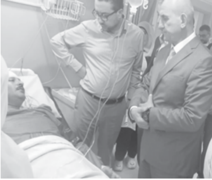
الانباط - جرش

ومراجع، وموظف شركة خدمات، مبينا أن الاعتداء لم يكن نتيجة احتكاك أو خلافا مع أي من الكوادر الطبية. وأشار الشبول إلى أن الحالات قيد العلاج وتحت المتابعة الطبية، حيث أن 3 إصابات حالتهم بسيطة والبقية متوسطة باستثناء حالة تحتاج إلى تدخل جراحي لوجود نزف دموي في الصدر، وجرى تحويلها إلى مستشفى الأمير راشد، بعد القيام بالإسعافات الأولية.