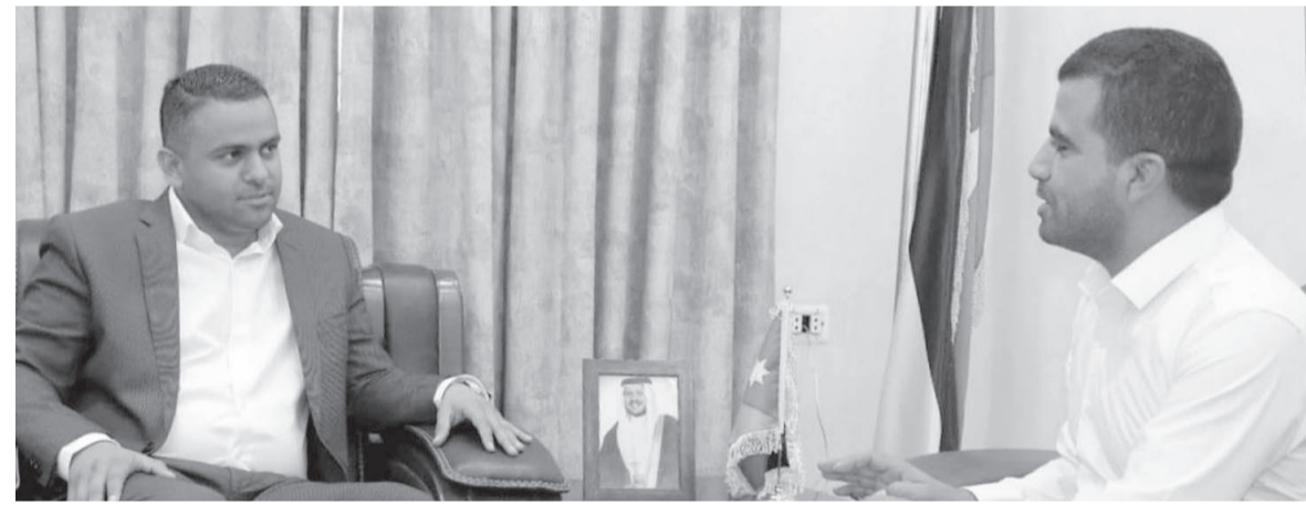
الأنباط - لواء الجيزة

مهنياً كقوة فعال يزخر ثقتها المواطنين بالبلدية وفق آليات المتابعة والتقييم بكل نزاهة وشفافية. ونوه بأن المجلس البلدي طرح عدة عطاءات لتحصين ورفع الطرق في مناطق البلدية، منها حدود البلدية وخارج التنظيم، ودراستها لبعض الشوارع المتهاكّة، وطرح عطاء لعمل ملاعب وقاعات للمناسبات، وعمل أسوار لـ ١٣ مقبرة بقيمة ١٨٥ ألف دينار، وهناك عطاء قيد الدراسة بقيمة ٤ مليون دينار لفتح وتعميد طرق جديدة، والانتهاء من مشروع مدخل منطقة أرينية الذي كان يشكل مشكلة حقيقية لقاطنيها.