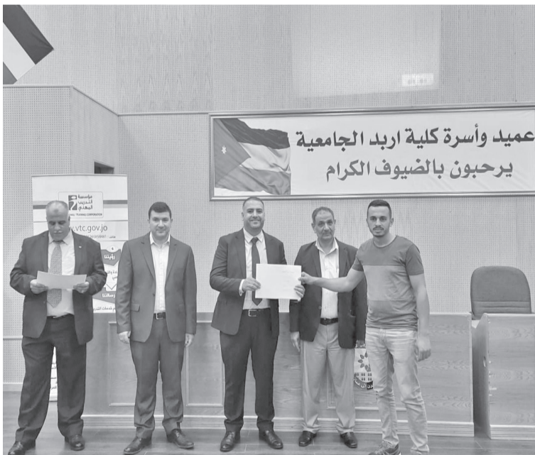
الانباط - اربد

على التوجهات المحلية والعالمية، وأهمية استخدام التكنولوجيا الحديثة في العملية التدريبية لتوفير العمالة المهنية والفنية القادرة على مواكبة التطورات المتسارعة في سوق العمل.