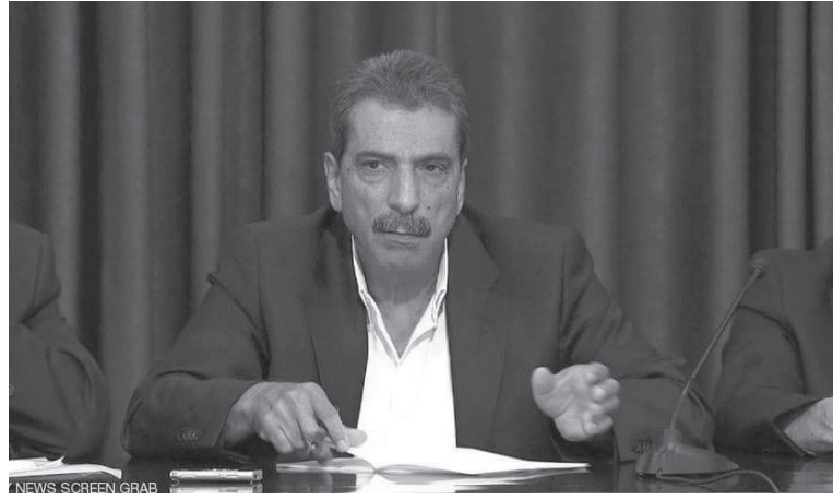
NEWS GREEN LAB