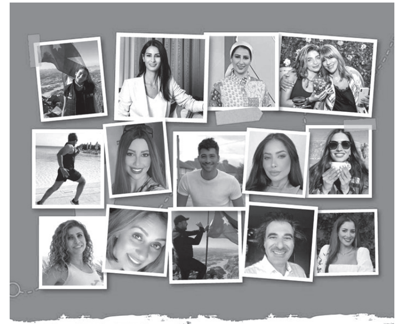
مؤسسة الحسين للسرطان مركز الحسين للسرطان الأردن السرطان الأردن TREKS orange

المقتردين في مركز الحسين للسرطان. وشهدت المبادرة في رحلتها الثلاث السابقة نجاحاً في الوصول إلى الهدف المراد جمعه من التبرعات، ولأقتت تضاملاً على صفحات التواصل الاجتماعي للمشاركة فيها، فيما سيخجل الرحلة الرابعة للمبادرة قيام أعضاء الفريق المكون من 15 ناشطاً وناشطة بجمع التبرعات من متابعي صفحات التواصل الاجتماعي الخاصة بهم للوصول إلى الهدف المراد تحقيقه وهو 100 ألف دينار أردني.