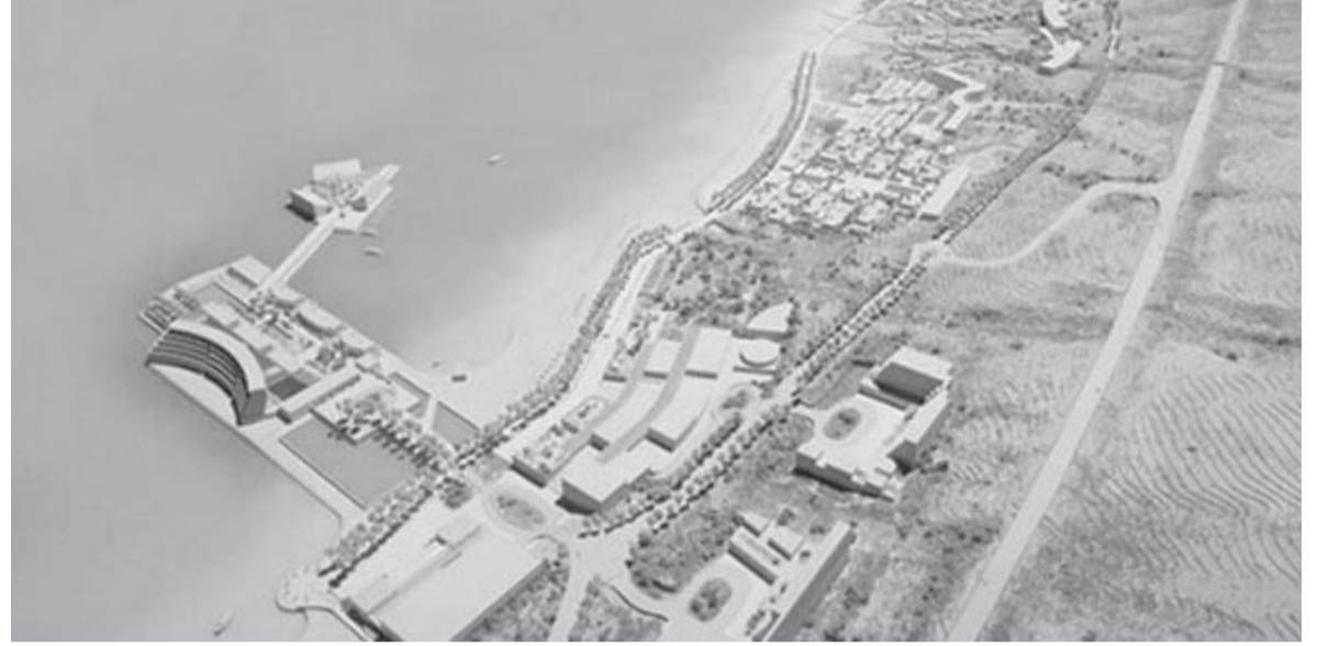
الانباط - وكالات

ومقاومة الاستيطان التابع لمنظمة التحرير الفلسطينية أوضح في تقرير نشره أمس على موقعه الإلكتروني أن البحر الميت الذي يحرم الاحتلال الفلسطينيين من زيارته يخسر سنويا مساحات من ارضه بفعل ممارسات سلطات الاحتلال التي تحجز المنابع التي تغذي البحر أما ما تبقى من مساحة تغمرها المياه فيخطط الاحتلال للاستيلاء عليها وذلك في إطار سطوه المستمر على مخدرات الشعب الفلسطيني وشرواته الطبيعية حيث أعلن مخططات لإقامة بؤر استيطانية عاتمة على الماء