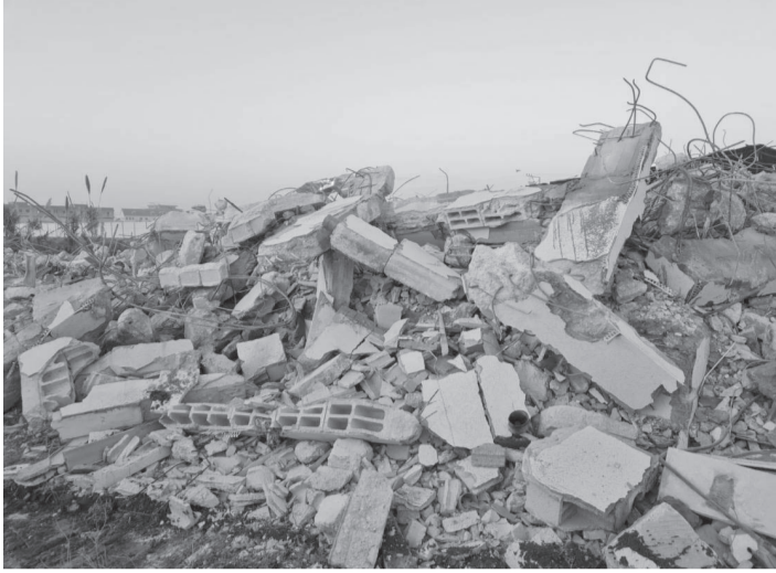
الانباط - وكالات

هدمت قوات الاحتلال الإسرائيلي أكثر من ٨ آلاف مبنى فلسطيني، وهجر آلاف المواطنين الفلسطينيين منذ عام ٢٠٠٩، وحتى نهاية أغسطس، حسب تقرير للأمم المتحدة وفي تقرير لمكتب الشؤون الإنسانية التابع للأمم المتحدة "أوتشا"، قال إن سلطات الاحتلال الإسرائيلي هدمت ثمانية آلاف و٧٤٦ مبنى فلسطينيا وأضاف التقرير أن عمليات الهدم أدت إلى تهجير نحو ١٣ ألف مواطن فلسطيني، وألحقت أضرارا بنحو ١٥٢ ألف آخرين وأشار إلى أن عمليات الهدم أدت أيضاً إلى حدوث أضرار بنحو ١٥٩ ألف و٥٥٩ منزلاً وبين أن المباني المهدامة قد تكون سكنية،