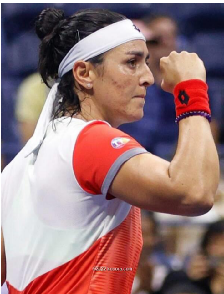
امريكا - وكالات

والتي تقلبت على الأمريكية كوكو جوف، بعد أن فازت عليها بمجموعتين دون رد، وسبق لجابر أن تقابلت مع جارسيا في مناسبتين، الأولى في الدور الأول لأمريكا المفتوحة 2019 وفازت التونسية بمجموعتين دون مقابل، والمرة الثانية في الدور الثاني من بطولة أستراليا المفتوحة لسنة 2020، وكانت الغلبة للتونسية أنس جابر أيضا بمجموعتين لمجموعة. ورغم الاسبقية المعنوية فإن مهمة أنس جابر لن تكون سهلة يوم الجمعة أمام جارسيا التي حققت الفوز رقم 13 على التوالي.