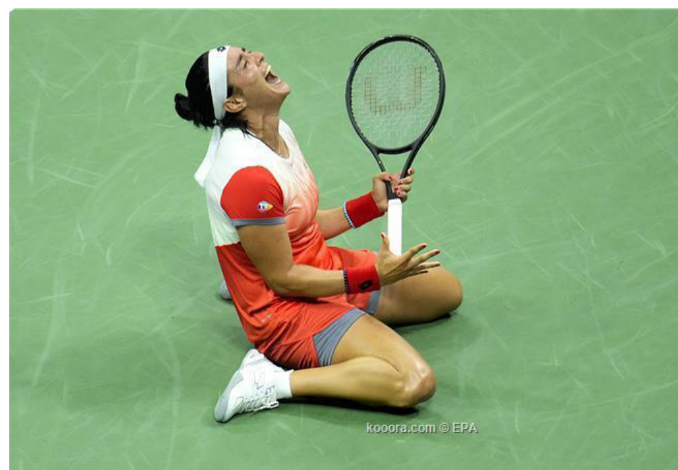
امريكا - وكالات

نجحت لاعبة التنس أنس جابر، فجر الجمعة، في بلوغ نهائي بطولة أمريكا المفتوحة للتنس، على حساب الفرنسية كارولين جارسيا. وفازت أنس جابر على كارولين جارسيا، بمجموعتين دون رد، بواقع ٦-١ و ٦-٣، في غضون ساعة وه دقائق. للاعبة التونسية دخلت المباراة بقوة، ونجحت في كسر إرسال كارولين جارسيا ٣ مرات، مما جعلها تحسم المجموعة الأولى بسهولة ١-٦ خلال ٢٣ دقيقة. وفي المجموعة الثانية، أخذت أنس جابر، الأسبقية بكسر إرسال لاعبة الفرنسية، ونجحت في مواصلة تقدمها حتى حسمت الأمور ٦-٣. وستلعب النجمة التونسية في نهائي بطولة أمريكا المفتوحة ضد البولندية إيجا شفيونتيك، الصنفة الأولى عالميا. وتغلبت شفيونتيك في نصف النهائي على البيلاروسية أرينا سابلينكا الصنفة السادسة، بمجموعتين لمجموعة واحدة، بعد مباراة مثيرة استغرقت ساعتين و١١ دقيقة. وقالت أنس جابر بعد الفوز "المباراة لم تكن سهلة لكنني لعبت جيدا، ولم أترك الفرصة لثانستي لتسيطر على اللعب، وتابعت "قدمت مباراة كبيرة تكتيكية، وسمعت نصائح تدريبي وطبقتها بحذافيرها لأول مرة، وأضاف "أنا سعيدة بهذا الإنجاز وسأعمل كل ما في وسعي للحصول على لقب هذه البطولة الكبرى".