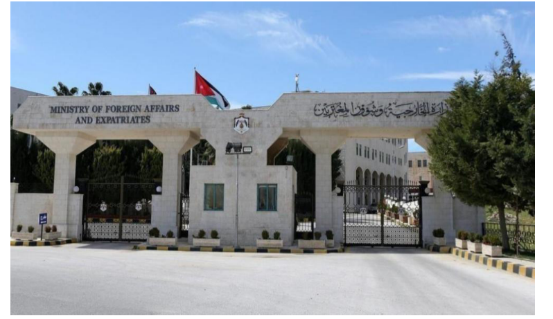
الإنباط - عمان أكددت وزارة الخارجية وشؤون

وإتصالاتها لعودتهم إلى الأردن. وذكر أبو الفول، أن السفارة في نيروبي تابعت مغادرتهم مدينة مومباسا يوم أمس الخميس باتجاه العاصمة الكينية نيروبي التي تبعد نحو ٥٠٠ كم عن مومباسا، وتواجد السفير في نيروبي في المطار لتابعة إجراءات السفر وعودتهم إلى المملكة. وأضاف، أنهم غادروا نيروبي فجر اليوم الجمعة باتجاه عمان عبر مطار القاهرة ترانزيت، ومن المتوقع وصولهم مساء اليوم إلى عمان، فيما تبقى شخص واحد فقط في نيروبي وتجري السفارة ترتيبات لعودته يوم غد. كما تتابع السفارة الأردنية في القاهرة إجراءات استكمال رحلة سفرهم للعودة للأردن خلال تواجدهم في منطقة الترانزيت.