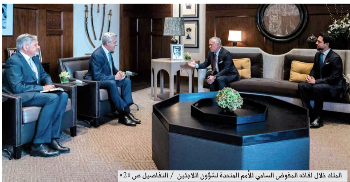
الملك خلال لقائه المفوض السامي للأمم المتحدة لشؤون اللاجئين / التفاصيل ص «2»