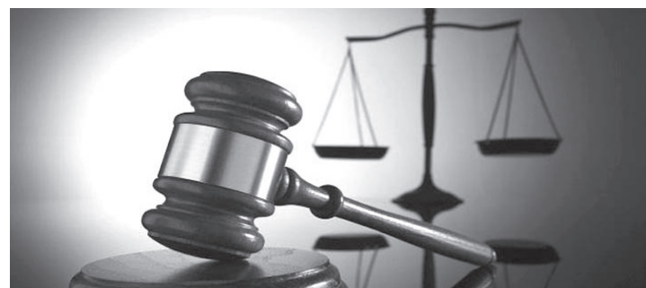
الأنباط - خاص

عليه مع الجهة الطبية، وهذا مخالف لتعليمات التأمين الصحي، حيث أن «الغرم بالغنم»، فمن غير المجهول ان تستفيد نقابة المهندسين من خصم الجهة الطبية على قيمة المطالبة بكل بند، ولا يستفيد منها المشترك (المدعي) حيث كان يتوجب على نقابة المهندسين أن تقوم بخصم مبلغ الاضفاء من الجهة الطبية من إجمالي الفاتورة الطبية، ومن ثم تقوم باحساب نسبة تحمل المشترك لديها، حيث قامت المدعي عليها (نقابة المهندسين) باستثناء مبالغ مالية دون وجه حق من المدعي وذلك لتجاوز سقف العلاج عن ٦٠٠٠ ستة آلاف دينار، ونتيجة ذلك تكبد المدعي مبلغ ٣٣٥.٢٠٠ دينار، في حين ان المبلغ المستحق على المدعي هو ٢٢٠.٣٢٤ دينار والزامها بالرسوم والصاريق والفائدة والأتعاب .