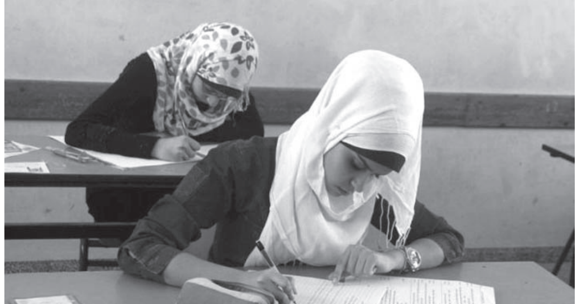
الأنباط - شذا حتملة

التربية تكتفي بـ التعليق «الشكاوى قيد الدراسة»