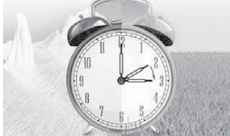
الأنباط - سالي صبيحات

عايش: قرار التوقيت الصيفي غير منبثق عن دراسة علمية