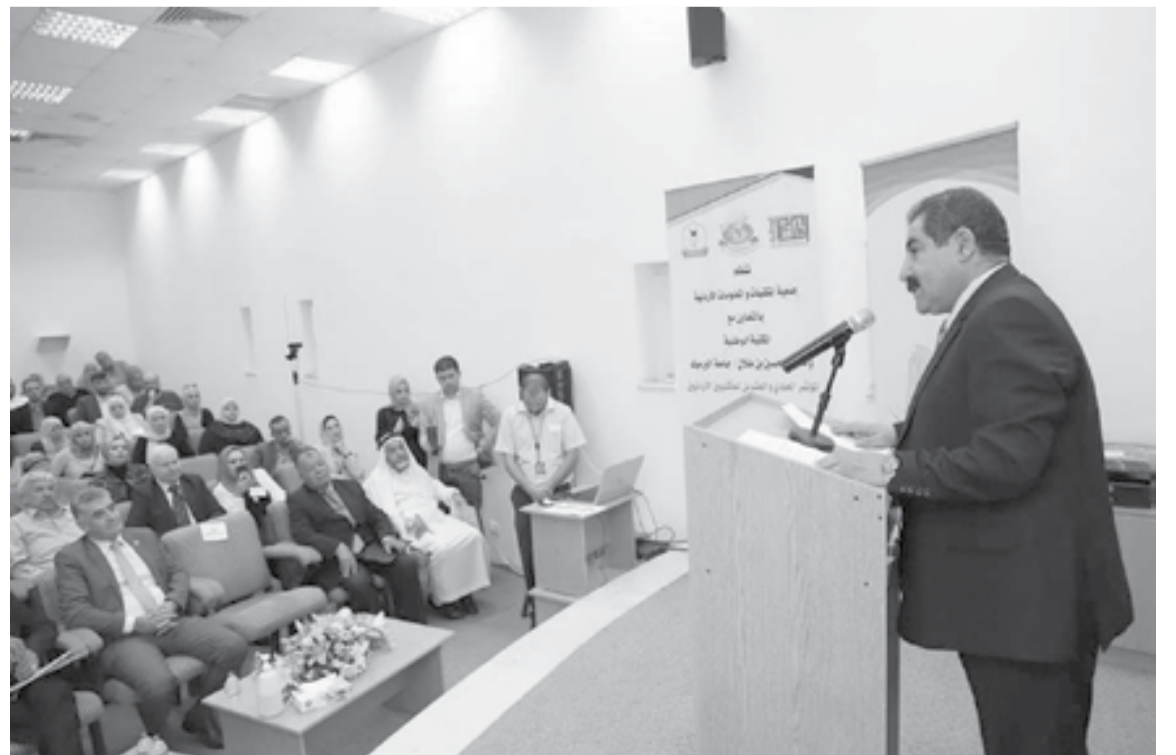
الأنباط - اربد

الذي تنظمه جمعية المكتبات والمعلومات الأردنية، بالتعاون مع المكتبة الوطنية، ومكتبة الحسين بن طلال في جامعة اليرموك.