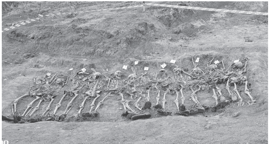
نعمت الخورة – أذربيجان

هناك في اديلي حيث تتوزع جثث جماعية تحت التراب، لم يحد مكانها بعد من قبل المسؤولين والمتابعين الأذربيين في قرية اديلي التابعة لمحافظة خوجاوند.