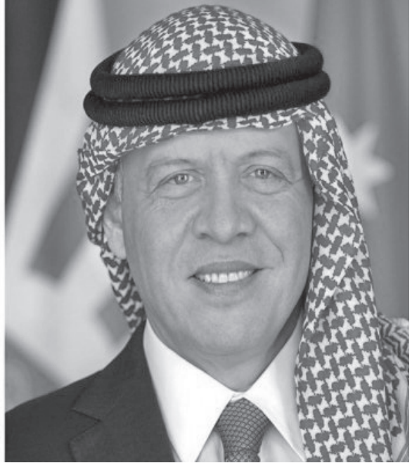
للإسلام وإبرازها في المحافل الدولية.