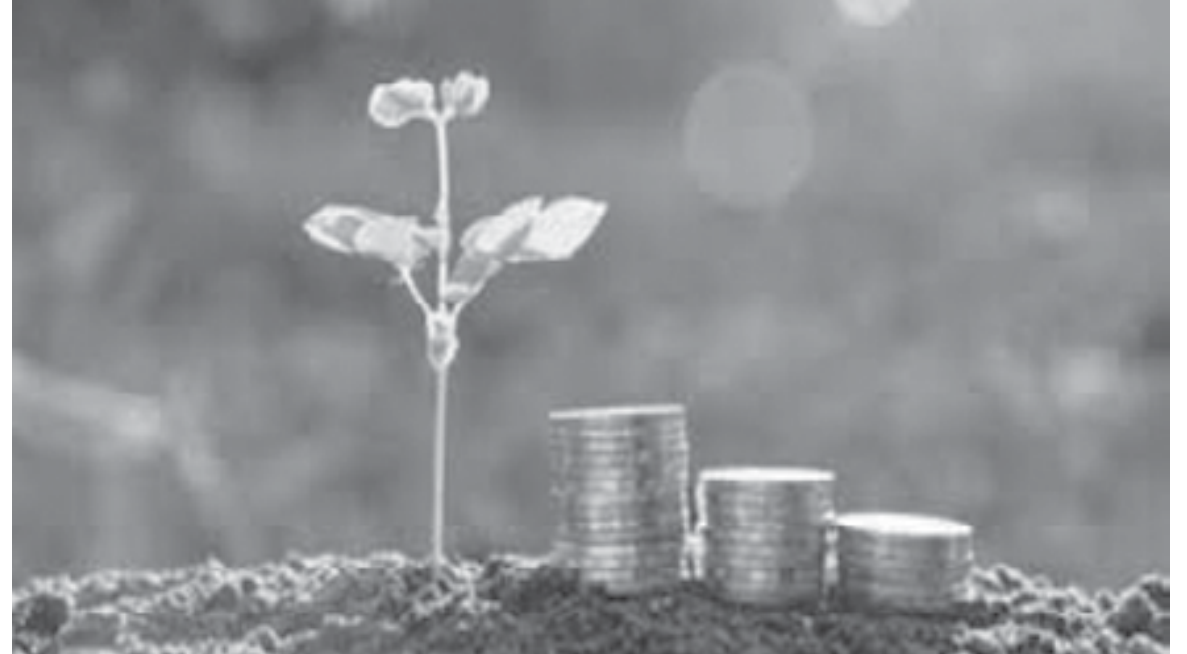
الأنباط - سبأ السكر

شهد سوق التمويل الأخضر العالمي على مدار العقد الماضي نمواً سريعاً، في ظل تطوير أدوات مالية كالسندات المصنفة باعتبارها خضراء والصكوك غير المصنفة، والقروض الخضراء، وصناديق الاستثمار الخضراء، والتأمين الأخضر، والصكوك الخضراء التي صدرت في الآونة الأخيرة. وعلى الرغم من إصدار أول سندات خضراء في عام 2008، إلا أن تطور السوق بشكل ضخم لحشد التمويل لصالح أهداف التنمية المستدامة السبعة عشر من خلال توفير الهياكل المبتكرة والتصنيفات والأطر الحاكمة، كشف أن العمل في مجال ما سيؤثر على النتائج في مجالات أخرى، وأن التنمية يجب أن توازن بين الاستدامة الاجتماعية والاقتصادية والبيئية.