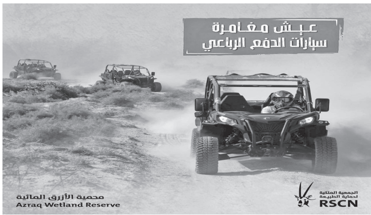
عيش مغامرة سيارات الدفع الرباعي