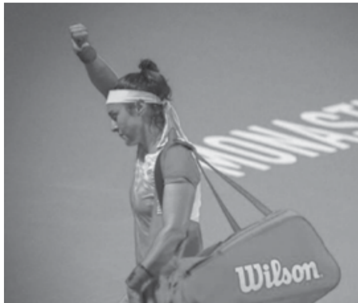
باريس - وكالات

السادسة والسابعة. وواصلت الأمريكية جوجو جوف احتلال المركز الثامن، تليها الرومانية سيومونا هاليب تاسعة، واختتمت الفرنسية كارولين جارسيا قائمة أفضل ١٠ لاعبات. وكانت اللاعبة التونسية أنس جابر، قد شاركت الأسبوع الماضي في بطولة اليااسمين المفتوحة بالمستديرات الـ ٢٥٠ نقطة، وأصدرت فرصة التتويج باللقب الرابع في مسيرتها الاحترافية، إثر خسارتها المفاجئة في الدور ربع النهائي أمام الأمريكية كلير ليو بمجموعتين لواحدة. أما البلجيكية إليز ميرتينز، فقد استقادت من فوزها بالقب اليااسمين وقفزت ٦ مراكز لتصبح في المرتبة الـ ٣٦ عالميا، كما قفزت الوصيفة الفرنسية كورنيه ٥ مراكز لتصبح في المرتبة الـ ٢٢ عالميا، أما الأمريكية كلير ليو، فقفزت ٩ مراكز لتصبح في المرتبة الـ ٦٤ عالميا. وتراجعت اللاعبة المصرية ميار شريف مركزا، لتصبح في المرتبة ٥٠ عالميا.