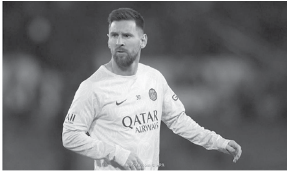
الأنباط - علي عويس

الكرواتي لوكا مودريتش قائد منتخب بلاده ونجم ريال مدريد الاسباني وأحد افضل لاعبي خط الوسط في العالم يسعى جاهدا لختم مسيرته بأفضل طريقة ممكنة بالتتويج بلقب الموندريال ، وكان مودريتش قد قاد المنتخب الكرواتي لنهائي الموندريال الماضي لكن فرنسا استطاعت ان تفوز بالمباراة وتتوج باللقب ، ويعد منتخب كرواتيا من اهم المنتخبات على مستوى القارة الاوربية رغم عدم تحقيقه لللقب الا انه دائما ما يكون خصما صعبا ضد الفرق المنافسة له.