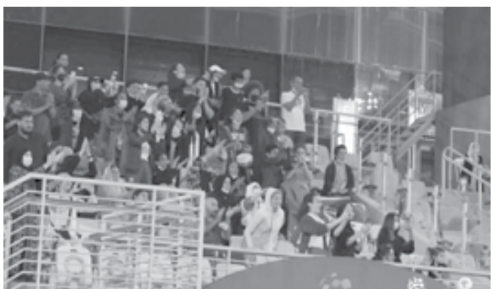
الرياض - وكالات

٢٠٢١ وبطولة المملكة ٢٠٢٢، والتي كانت أولى البطولات الرسمية لكرة النسائية تحت إشراف الاتحاد السعودي لكرة القدم. تأتي هذه الخطوة بعد نجاح تجربة دخول الجمهور لمباريات بطولة غرب آسيا لسيدات الصالات ٢٠٢٢، والتي أقيمت في شهر يونيو/ حزيران الماضي بصالة مدينة الملك عبدالله الرياضية في مدينة جدة، وانتهت بحصول صاحب الأرض على الوصافة، وفوز منتخب العراق باللقب. يذكر أن الاتحاد السعودي لكرة القدم قد تقدم للاتحاد الآسيوي لكرة القدم، في بداية شهر أغسطس/ آب الماضي، بطلب استضافة نهائيات كأس آسيا للسيدات ٢٠٢٦.