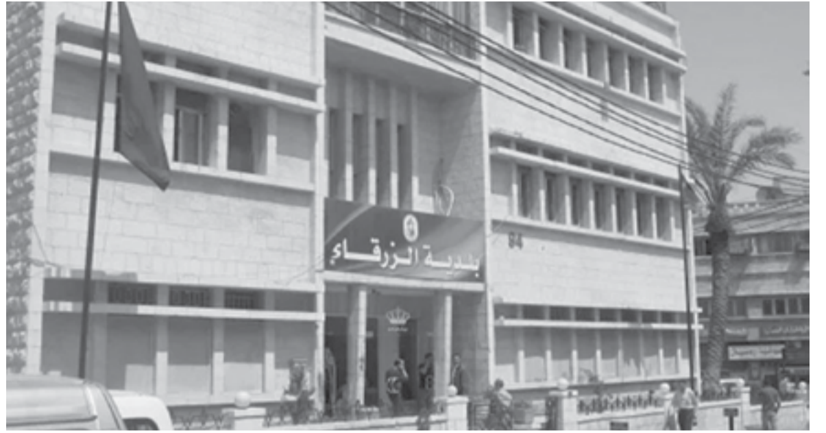
الأنباط - زينة البربور

مدار الساعة قامت خلال هذه الفترة بتنظيف مجاري الاودية والسيول ومناهل تصريف مياه الامطار ، وعمل سواتر ترابية ، وتعميق مجاري الاودية بالإضافة لعمل الصيانة اللازمة للآليات لضمان ديمومتها في العمل وتنظيم كشف يحتوي على ساقيتها وارقام هواتهم وعناوهم. وأضاف أنه تم صيانة ماتورات شط المياه ، وعمل تجربة لها لتزويد المناطق بالمعدات اللازمة لاستقبال فصل الشتاء مشيراً إلى أنه تم التعاقد على استئجار بعض من الآليات الخاصة ، لتكون جاهزة ان دعت الحاجة ، مثل تنكات النضح ، وباكو جنزير ، وصهرج جت ، ولودر،