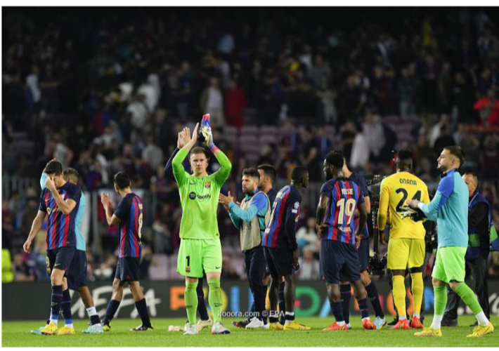
برشلونة - وكالات

مجموعته. ويات برشلونة (٤ نقاط) في المركز الثالث بمجموعته، التي يتصدرها بايرن ميونخ برصيد ١٢ نقطة، يليه إنتر ميلان في الوصافة (٧ نقاط). وكفي يصعد برشلونة، يحتاج إلى الفوز على بايرن ميونخ وفيكيتوريا بلزن، بالإضافة إلى عدم انتصار برشلونة سيخسر ٢٠ مليون يورو، إذا لم يصل إلى ثمن نهائي دوري أبطال أوروبا. وأشارت إلى أن برشلونة لن ينجح في تعويض هذه الأموال، حتى لو فاز بلقب بطولة الدوري الأوروبي، التي قد ينتقل لها، إذا احتل المركز الثالث في