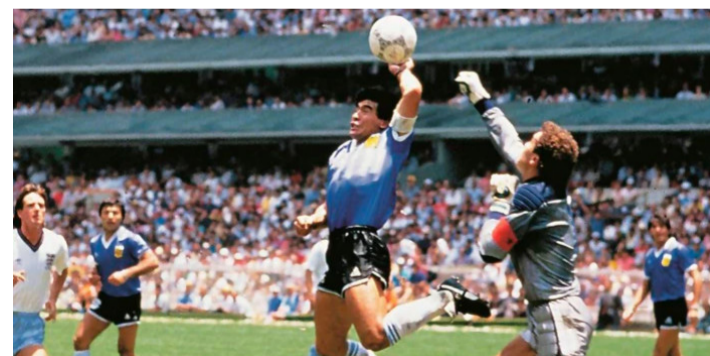
الارجننتين - وكالات

قرر أن تدخل الكرة، التي استخدمها ديجو أرماندو مارادونا لتسجيل هدفه المشهور "بيد الله" أمام المنتخب الإنجليزي في كأس العالم لكرة القدم نسخة ١٩٨٦، في مزاد الشهر المقبل، بتكلفة تتراوح من ٢,٨ مليون دولار إلى ٣,٣ مليون دولار. وسجل مارادونا الهدف عندما ضرب الكرة بيده من أمام الحارس الإنجليزي بيتر شيلتون ليفتح التسجيل في مباراة دور الثمانية على ملعب أرتيكا في مكسيكو سيتي. ويعد الواقعة المثيرة للجدل، سجل مارادونا هدفاً ثانياً بمجهود فردي رائع، والذي أصبح معروفاً بلقب "هدف القرن"، وفاز المنتخب الأرجنتيني باللقب ٢ / ١ قبل أن يتوج باللقب في نهاية البطولة. ويمتلك الحكم علي بن ناصر، الذي أدار المباراة وفشل في اكتشاف مسة اليد، الكرة، وسيتم بيع الكرة من قبل دار جراهام بود للمزادات، يوم الأربعاء ١٦ تشرين الثاني/نوفمبر. وذكرت وكالة