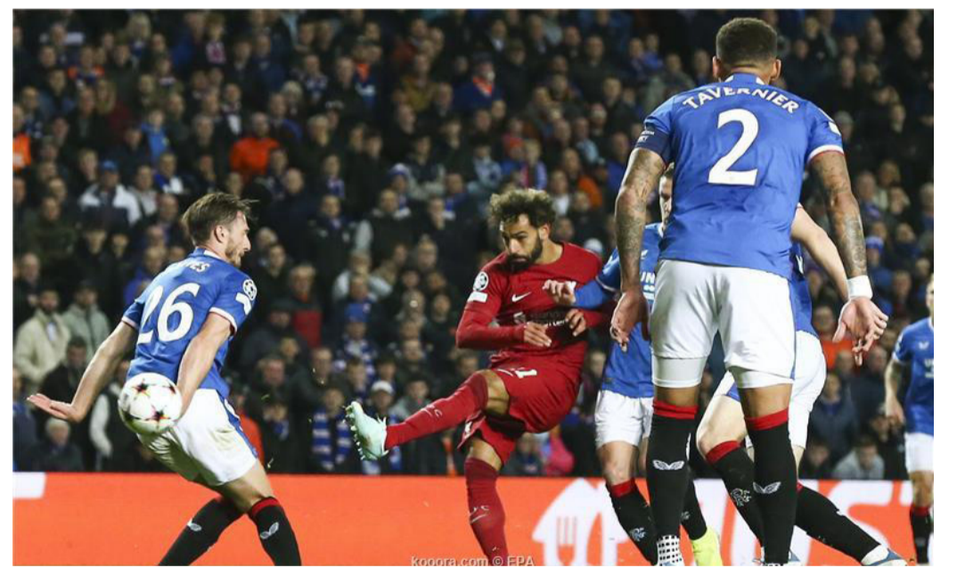
لندن - وكالات

سجل محمد صلاح، نجم ليفربول، ٣ أهداف في مباراة الريدز أمام مضيفه جلاسكو رينجرز الإسكتلندي، مساء الأربعاء، ضمن منافسات الجولة ٤ للمجموعة ه بدور المجموعات من مسابقة دوري أبطال أوروبا، والتي انتهت بنتيجة (٧-١). وشارك صلاح بديلاً في الشوط الثاني، ليسجل ثلاثية، ويضع حداً للانتقادات التي طالته في الآونة الأخيرة بسبب ضعف إنتاجه التهديفي هذا الموسم. وسجل صلاح الهدف الرابع لفريقه في الدقيقة ٧٥، عندما تلقى تمريرة من الهديل الآخر ديوجو جوتا، ليمرر في الناحية اليمنى، ويسدد كرة نحو القائم البعيد من زاوية صعبة. ويعد و دقائق، عاد جوتا ليمرر إلى صلاح الذي تقدم بالكرة وأخذ وقته قبل أن يسدها على يسار الحارس، مسجلاً ثاني أهدافه. وأكمل صلاح الهاتريك في الدقيقة ٨١، عندما تلقى تمريرة ثالثة من جوتا، ليسدد هذه الكرة على يمين الحارس. ووفقاً لما ذكرته شبكة إحصائيات أوبستا، سجل صلاح الهاتريك في غضون ٦ دقائق و١٢ ثانية، وهو أسرع هاتريك في تاريخ دوري أبطال أوروبا.