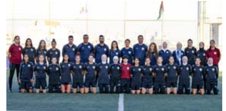
الأنباط - عمان

يلتقي المنتخب الوطني النسوي للشابات تحت سن 20 لكرة القدم، مع نظيره اللبناني، عند الثانية من مساء الجمعة، في ثاني مبارياته في بطولة غرب آسيا للشابات التي تستضيفها العاصمة اللبنانية بيروت. ويبحث المنتخب الوطني عن تحقيق الفوز، لتعويض خسارته أمام منتخب سوريا بنتيجة 4-3