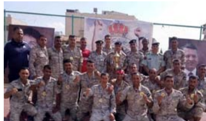
الأنباط - عمان

فريق المنطقة العسكرية الشرقية، والثالث قيادة المنطقة العسكرية الشمالية، والرابع قيادة سلاح الجو الملكي، وجاء في الرابع قيادة القوة البحرية والزوارق الملكية، على صعيد آخر تستعد مديرية الاتحاد الرياضي العسكري لإقامة بطولة القوات المسلحة الأردنية لكرة اليد خلال الفترة من 30 الحالي وحتى 8 الشهر المقبل في صالة قصر الرياضة في مدينة الحسين للشباب بمشاركة فرق تمثل وحدات وتشكيلات القوات المسلحة الأردنية الجيش العربي.