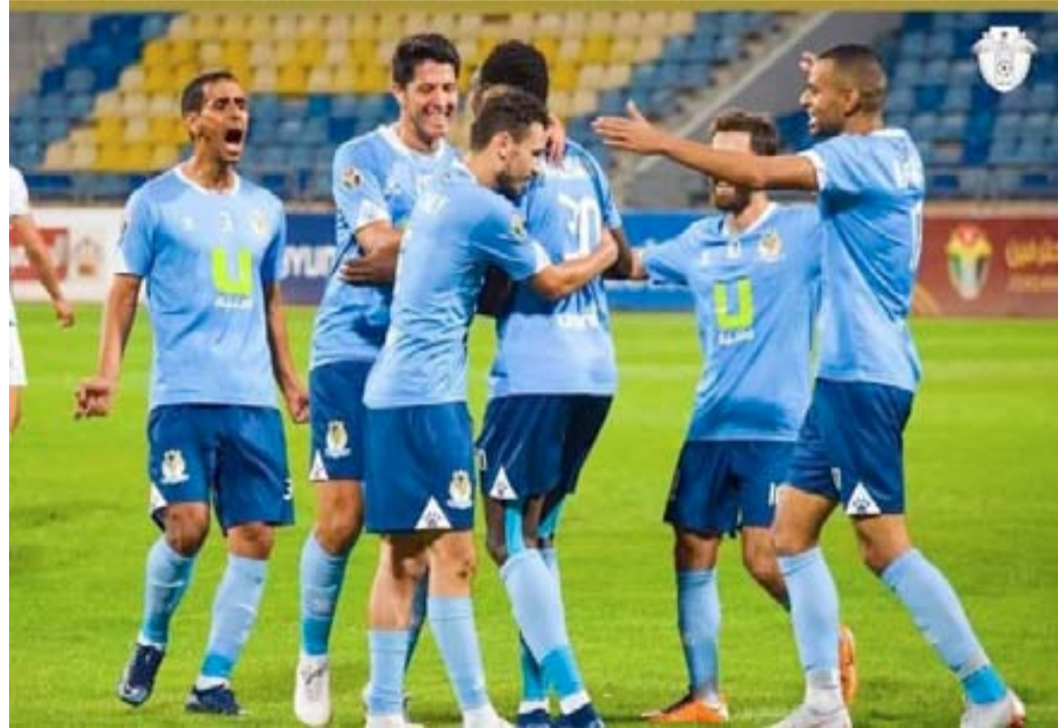
الأنباط - عمان

تستأنف مساء الجمعة منافسات الاسبوع 20 من دوري الكرة لنادية المحترفين باقامة مباراتين حيث يلتقي في الاولى فريق الحسين ضيفا على الجزيرة عند السادسة مساء الجمعة، على ستاد الملك عبدالله الثاني، قبل أن يستقبل مغير السرحان نظيره الفيصلي عند الثامنة والنصف على ستاد الأمير محمد في اللقاء الاول يستقبل فريق الجزيرة نظيره الحسين إربيد في لقاء سيكون مهما للفريقين. وخصوصا الجزيرة الذي لن يكتفي سوى الفوز للتمسك بأمل البقاء في دوري ان حقق الفوز في مبارياته الحاسمة القادمة وبخاصة أن أي نتيجة غير ذلك قد تسرع من حسم هبوطه. ويحتل فريق الجزيرة المركز قبل الأخير برصيد "14" نقطة ويتقدم بفارق الأهداف فقط عن الصريح صاحب المركز الأخير. بدوره فإن الحسين إربيد يسعى لتحقيق نهضة جديدة بعد انتكاسة خروجه المفاجئ من بطولة كأس الأردن. ورغم أن حظوظ الحسين إربيد في المنافسة على اللقب أصبحت صعبة إلا أنه يسعى للظفر بالوصافة على أقل تقدير لضمان المشاركة الخارجية، حيث يستقر حالياً بالمركز الثالث برصيد "11" نقطة. ويسعى للفوز ولا يبدل لبقاء قريبا من المقدمة تحسبا لتعثر منافسيه للعودة الى المقدمة . وفي اللقاء الثاني يواجه فريق مغير السرحان منافسه الفيصلي في لقاء يجمعهما على