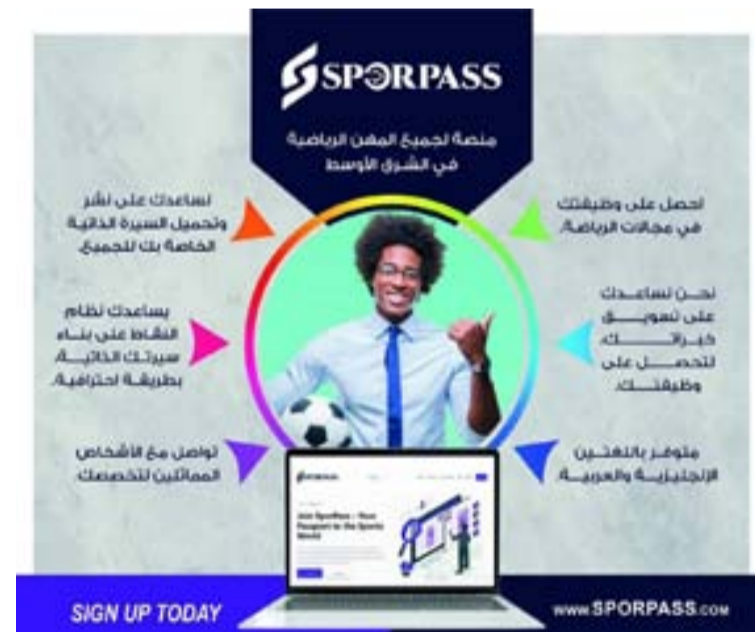
الأنباط - عمان

أطلقت أكاديمية بحث وتطوير أنشطة علوم الرياضة (دراسا)، منصة (sporpass) للتوظيف في المهن الرياضية من مقرها في دبي بدولة الإمارات العربية المتحدة. وتعتبر (sporpass) المنصة الأولى من نوعها في الشرق الأوسط، وتمثل جسرا يربط ما بين حملة المؤهلات التخصصية في المجال الرياضي، وبين المؤسسات والهيئات والشركات التي تطلب هذه الوظائف. وتعد منصة (sporpass)، واحدة من مبادرات أكاديمية بحث وتطوير أنشطة علوم الرياضة (دراسا)، كونها أكاديمية متخصصة في بحث وتطوير أنشطة علوم الرياضة، وتقديم العديد من أنشطة التدريب والتوعية الصحية والأبحاث والاستشارات في المجال الرياضي، وبيت خبرة عربي يقدم استشارات عديدة في المجال الرياضي، كما لديها مجلة علمية محكمة دوليا ويأتي الهدف من إنشاء هذه المنصة المتفردة، لمساعدة المؤسسات والهيئات والشركات التي تطلب وظائف متخصصة في المجال