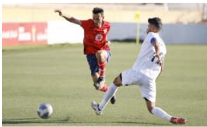
الأنباط - عمان

الصيانة اللازمة لأرضية الملعب وحسب التعديل، يلتقي اليرموك مع بلعما عند الرابعة عصر الأحد 23 تشرين الأول على ملعب السلط، على أن يواجه الأهلي نظيره الطرة في اليوم التالي على ذات الملعب، فيما تقام مباراة عمان FC والبقعة عند الرابعة عصر الثلاثاء على ستاد الأمير محمد.