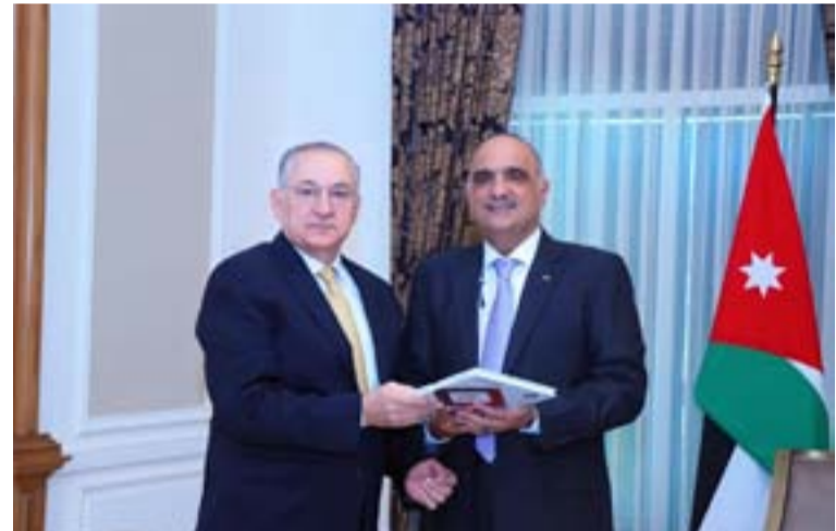
الملفات التحقيقية في قضايا الجنائيات أمام المحاكم وحالة من الهيئة بلغت نحو ٨٣ بالمئة.

ولفت إلى التماسك القانوني للقضايا التي تحيلها الهيئة للقضاء حيث تشير إحصائيات الهيئة إلى أن نسبة نجاح