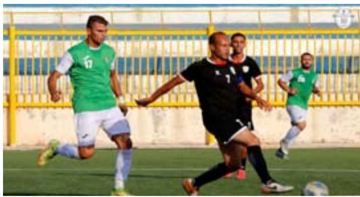
الأنباط - عمان

وقاز اتحاد الرمثا على العربي 2-0، والعالية على الكرمel 1-0، عمان FC على كفرسوم 2-0. ومع اختتام الأسبوع العاشر، يتعد الهاشمية بصدارة ترتيب الفرق برصيد 20 نقطة، يليه الجليل والأهلي 18، السرحان 14، اتحاد الرمثا 13، اليرموك 10، العالية 14، عمان FC والبقعة 12، الطرة 10، العربي 8، الكرمel وكفرسوم وبلعما 6.