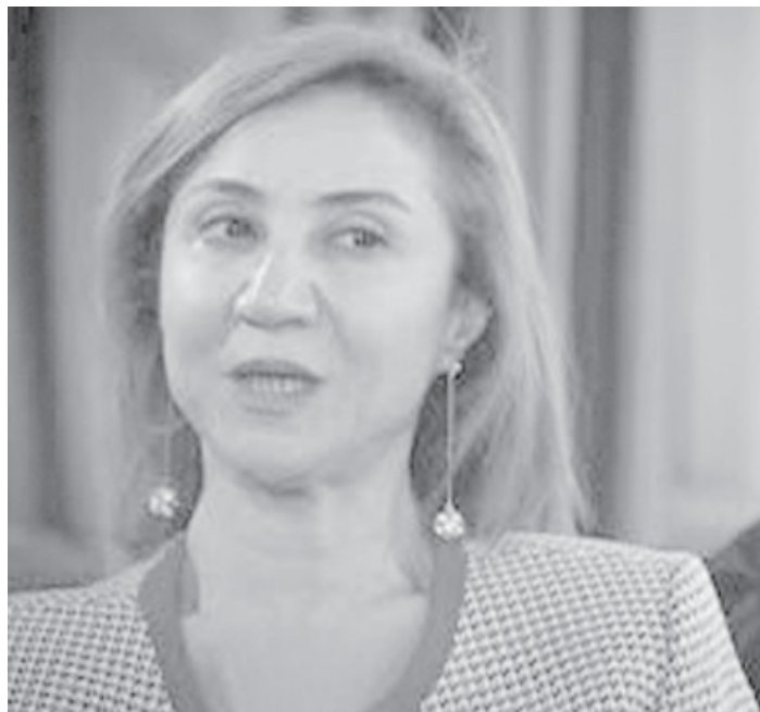
الأنباط - سبأ السكر

وكان تقرير للشركة الأردنية لأنظمة الدفع والتفصيص (جوباك)، أوضح أن قيمة معاملات نظام الدفع بواسطة المحافظ في شهر أيلول بلغ ١٢٥ مليون دينار، مقارنة مع ١٤١ مليون دينار في الشهر الذي سبقه، وبانخفاض نسبته ١١,٣٪، والذي أشار إلى أن ٩٢,٥٪ من هذه الأموال كانت عبر تحويل أموال و ٧,١٪ كعمليات سحب..