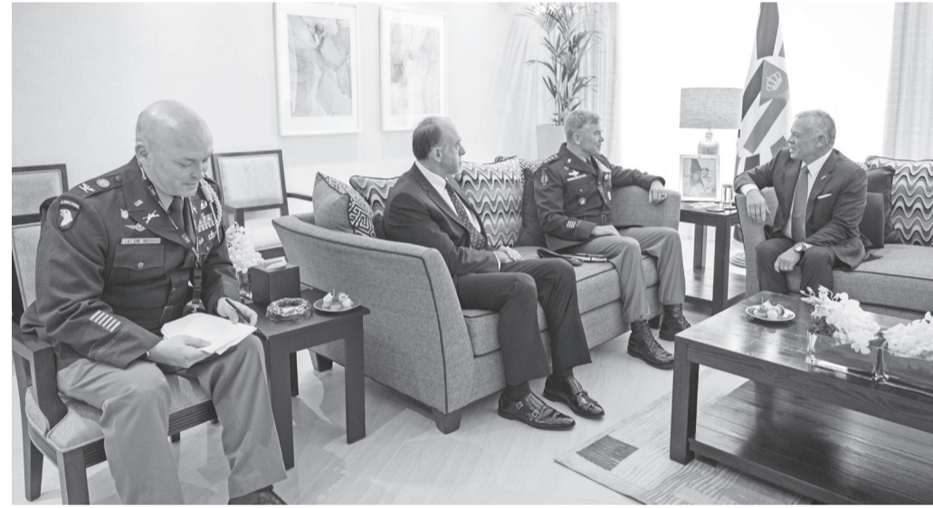
الانباط - العقبة

التقى جلالته الملك عبدالله الثاني، في العقبة أمس الثلاثاء، قائد قيادة العمليات الخاصة الأميركية الضيف أول بريان فينتون، وكبير مستشاري رئيس أركان الدفاع البريطاني لشؤون الشرق الأوسط وشمال إفريقيا الفريق جوي مارتن سامبسون. وجرى، خلال اللقاءين المنفصلين اللذين عقدا على هامش فعاليات مؤتمر ومعرض سوفكس ٢٠٢٢ بحضور سمو الأمير هاشم بن عبدالله الثاني، بحث سبل تعزيز التعاون بين الأردن والولايات المتحدة والمملكة المتحدة في المجالات العسكرية والدفاعية.