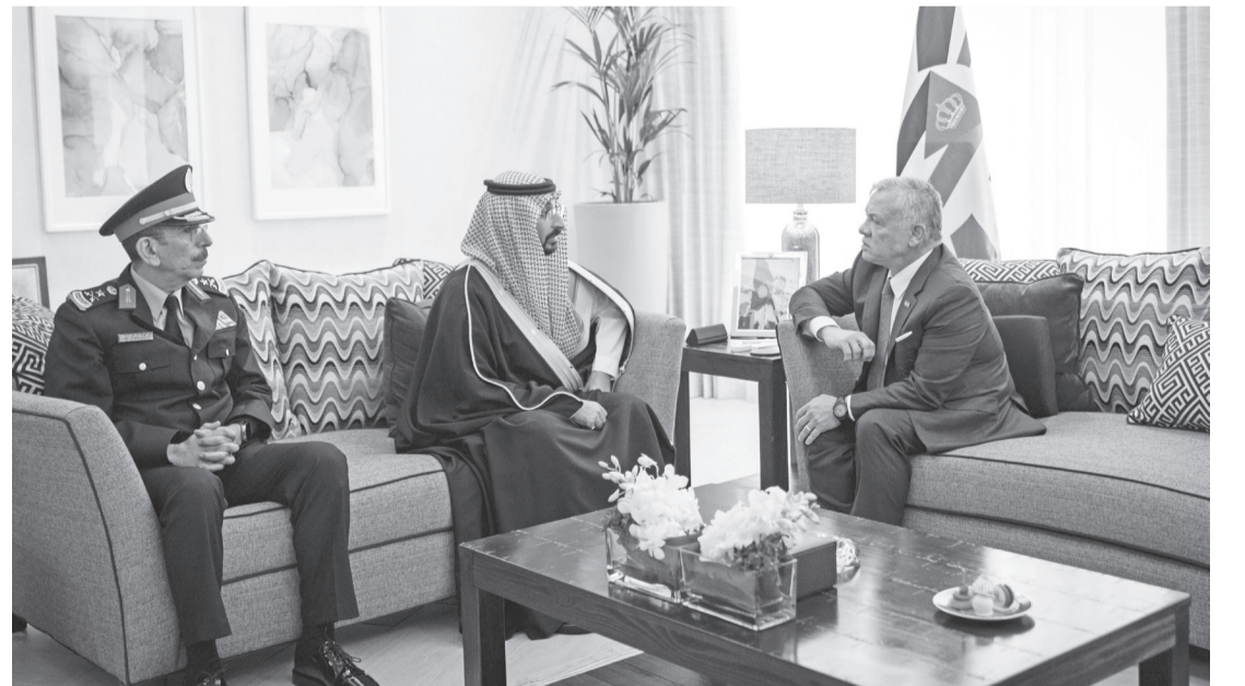
الانباط - العقبة

التقى جلالته الملك عبدالله الثاني، في العقبة أمس الثلاثاء، وزير الدفاع الكويتي الشيخ عبدالله علي العبدالله الصباح، ووزير الحرس الوطني السعودي سمو الأمير عبدالله بن بندر بن عبدالعزيز آل سعود، في لقاءين منفصلين على هامش فعاليات مؤتمر ومعرض سوفكس ٢٠٢٢.