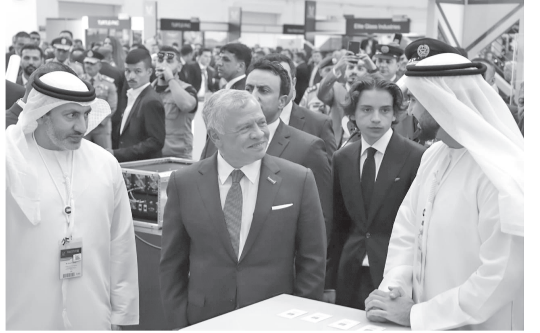
الانباط - العقبة

وقال مدير عام المركز الأردني للتصميم والتطوير / مدير عام شركة مؤتمر ومعرض العمليات الخاصة سوفكس العميد المهندس أيمن البطران، في كلمة له في حفل الافتتاح، إن المؤتمر، وبدعم جلالته الملك المستمر، أصبح مركزاً عالمياً لعرض آخر التطورات والتخصصات فيما يخص العمليات الخاصة. وألقى قائد مجموعة الملك عبدالله الثاني للقوات الخاصة الملكية العقيد نائل شقيرات كلمة، أعرب فيها عن تقديره لدعم جلالته المستمر للقوات الخاصة، والذي مكن القوات المسلحة من بناء شراكات وثيقة مع العديد من الدول الصديقة، مشيراً