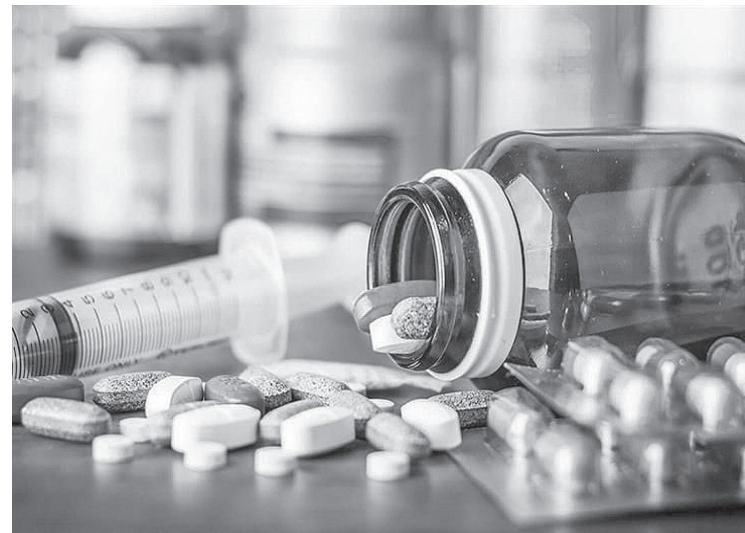
يغطي احتياجات السوق المحلي ومن مختلف المجموعات العلاجية لمدة تتراوح

من 4 إلى 6 شهور حسب فئات الأدوية. وهنا نطرح تساؤل، هل يعد تصريح مدير مؤسسة الغذاء والدواء يعتبر مخزون استراتيجي وهو العرف المتبع في هذه الحالة، وهل تعد الأدوية البديلة التي تعطى لـ المرضى تتفق مع الخطة العلاجية.