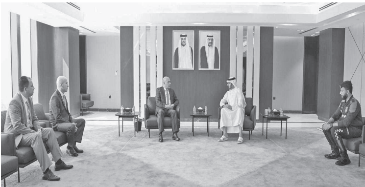
الانباط - الدوحة

بمكتبه في مقر قوة الأمن الداخلي ( لوبيا) بالدوحة.