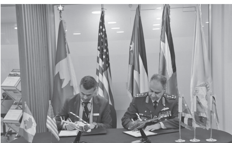
الأنباط - دينا محادين

وتتضمن الاتفاقية التي وقعها، قائد سلاح الجو الملكي العميد الركن الطيار محمد فتحى حياصات وعن شركة بيل تكسترون باتريك مولاي، تسليم الطائرات مع أدوات تدريب على الطيران ومجموعة شاملة من الأجهزة التدريبية المرتكزة على الكمبيوتر لتمكين الاعتماد العززالساليب التدريب الأساسية والمقدمة على التحليق بطائرة ذات محرك دوار.