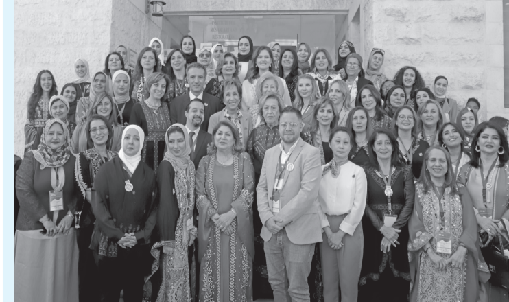
الانباط - مادبا

وأشادت سموها باختيار مركز الإعلاميات العربيات لمدينة مادبا لعقد المؤتمر، احتفاءً باختيارها عاصمةً للسياحة العربية لعام 2022، ولتسليط الضوء على هذه المدينة العريقة، وما فيها من تنوع سياحي وتراثي وتاريخي.