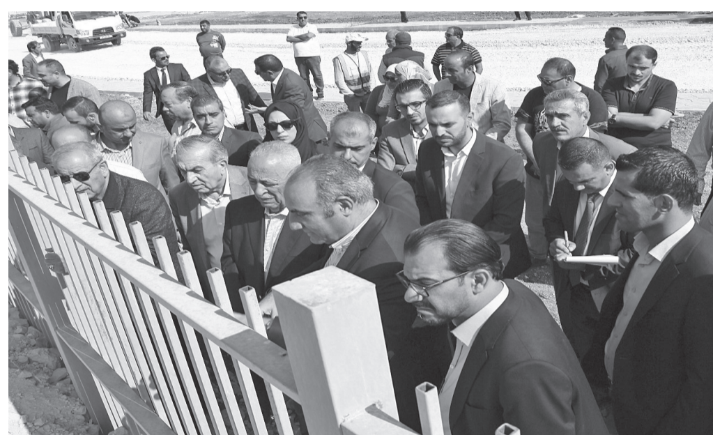
الانباط - الزرقاء

وخلال الاجتماع تم تقديم إيجاز وعرض تقديمي شمل جميع مراحل تنفيذ المشروع وحجم الإنجاز الذي وصل إليه العمل حالياً.