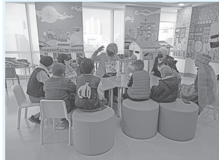
يعانقون الأشجار" على أطفال مركز الحسين للسرطان، ووزعت عليهم نسخا منها.

بدأت في جامعة البلقاء التطبيقية امس الثلاثاء، حملة توعية لتعزيز المشاركة السياسية للشباب تحت شعار "الحل مشاركة"، تنظمها عمادة شؤون الطلبة بالتعاون مع الهيئة المستقلة للانتخاب ومؤسسة ولي العهد. وتهدف الحملة إلى توعية طلبة الجامعات بمخرجات منظومة التحديث السياسي، وتسليط الضوء على أبرز مستجدات قانوني الانتخاب والأحزاب، وممارسة الشباب للعمل الحزبي في