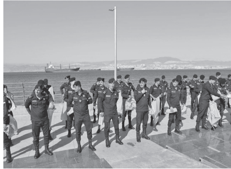
اهمية دور شركة ايلة للتطوير في محافظة العقبة سواء على الصعيد الاستثماري والاقتصادي أو الاجتماعي، مثمنا دعم الشركة المستمر للتنمية