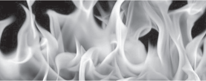
الانباط - العقبة

الشركة الرامية إلى تثقيف العاملين فيها حيال التعامل مع مختلف الحالات الطارئة من حرائق أو حوادث قد تحدث أثناء العمل الميداني، مثنئين الجهود التي يقدمها الدفاع المدني في التوعية والتثقيف والتدريب والوقاية والمحافظة على أرواح وممتلكات المواطنين.