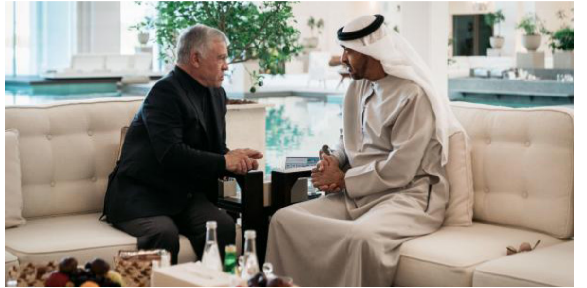
الانباط - أبو ظبي

التقى جلالة الملك عبدالله الثاني في أبوظبي، أمس الخميس، بأخيه سمو