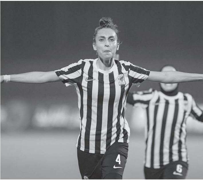
جدة - وكالات

24 من الشوط الأول، قبل أن تتلقى البطاقة الحمراء في الدقائق الأخيرة من عمر المباراة، لتلقي الهجالي البطاقة الحمراء لم يلغى ظهورها الأول المثالي مع فريقها الجديد، والذي أتى بعد رحلتها في قارة أوروبا مع فريق أولمبياد كلوج الروماني، والذي حققت معه إنجازاً شخصياً في هذا العام، انتقالها إلى الدوري السعودي الممتاز للسيدات لن يفي رحلتها الأوروبية، حيث أعلنت الهجالي في وقت سابق عبر حسابها الرسمي في إنستغرام، بأنها ستعود إلى فريقها أولمبياد كلوج الروماني مع بداية انطلاق مرحلة الإياب من الدوري الروماني للسيدات.