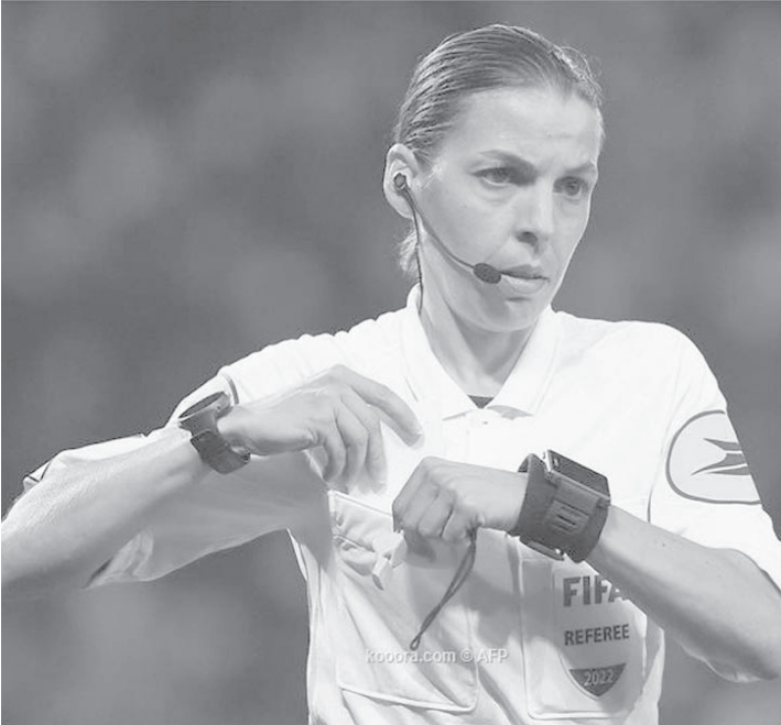
الدوحة - وكالات

وأدرجت فراشات والرواندية سليمة موكانسانجا، واليابانية يوشيمي ياماشيتا ضمن قائمة 36 حكما اختارهم الاتحاد الدولي "فيفا" لمونديال قطر، في حين تشارك ثلاث سيدات أخريات كحكيمات مساعدات. وشاركت فراشات كحكم رابع في مباراة بولندا والمكسيك، بالجولة الأولى من دور المجموعات في مونديال قطر.