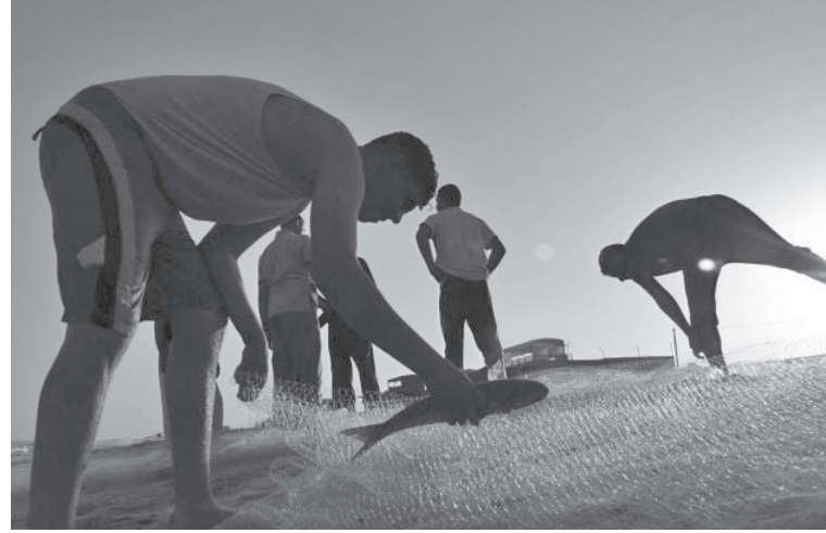
صيادا، من بينهم ٨ أطفال، فيما أصابت قوات الاحتلال خلال الهجمات ٢١ صيادا، وعلاوة على ذلك تخلل الهجمات