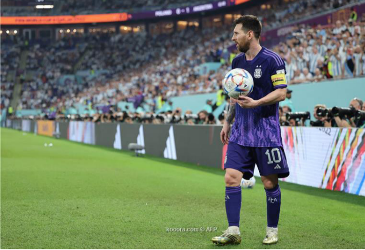
الدوحة - وكالات

وقال ميسي، خلال تصريحات نقلتها صحيفة "ريكورده" المكسيكية، «ما حدث كان سوء فهم، ومن يعرفني يعرف أنني لا أقلل من احترامي لأحد». وأضاف: "لست مضطرا للاعتذار، لأنني لم أقل من احترامي لشعب المكسيك ولا الفريق ولا أي شخص آخر". وقاد ميسي منتخب بلاده للفوز على بولندا بنتيجة (2-0)، رغم إهداره لركلة جزاء. وضرب منتخب المونديال، في المباراة المقرر إقامتها السبت المقبل.