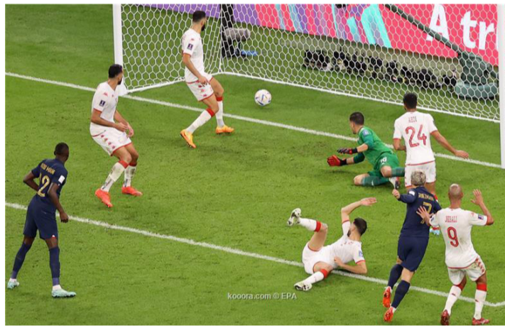
الدوحة - وكالات

والص وأعطى الأفضلية وغيرها من التصرفات الخارجة عن النص. ونشرت "مونت كارلو" صورة من ملعب المباراة تؤكد أن الحكم النيوزلندي ماتيو كونجر، استأنف بالفعل المباراة مجددا بركلة بداية من منتخب تونس قبل أن يطلق صافرة النهاية، وهي اللقطة التي لم يلتقطها البث التلفزيوني مباشرة. وأكدت أيضا "وقفا لهذه الصورة، فإن قرار الحكم باللجوء مجددا لتقنية الفيديو، يبيح باطلا وتعاضرا مع لوائح الفيفا، وقد يعطي منتخب فرنسا فرصة التعادل، ويحرم تونس من انتصارها الأول على الديوك، وختمت الشبكة الفرنسية، أن هذه المادة تمنع لجوء حكم المباراة لتقنية الفيديو حال استئناف المباراة بعد توقفها باسئتناء حالات معينة، مثل الخطأ في تحديد الهوية أو حدوث سلوك غير لائق مثل العنف والبصق