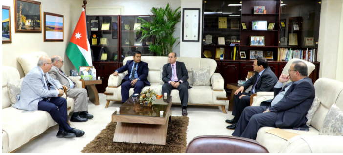
الأنباط - الزرقاء

تولي أهمية كبيرة للطلبة الوافدين ومتابعة أوضاعهم، مستعرضاً نشأة الجامعة وتطورها والبرامج والتخصصات العلمية على مستوى البكالوريوس والدراسات العليا والمشاريع البحثية المقدمة داخلياً وخارجياً واعداد الطلبة. من جانبه، قال المحقق الثقافي إن الهدف من الزيارة هو تعزيز العلاقات بين الجانبين لما تتميز به الجامعة من خريجين وتخصصات علمية أكاديمية مميزة. وأكد استعداد السفارة لتقديم الخدمات والتسهيلات كافة من تبادل الخبرات البحثية والعلمية بين الجانبين وتبادل الطلبة وبرامج التدريب. وفي ختام الزيارة جال المحقق الثقافي داخل الحرم الجامعي وأقسام ومرافق كلية الآداب.