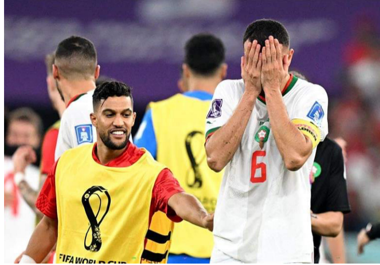
الدوحة - وكالات

تأهل منتخب المغرب لدور الثمن بعد فوزه على كندا 1-2 في الجولة الثالثة بدور المجموعات بكأس العالم بقطر. وتصدر منتخب الأسود المجموعة برصيد 7 نقاط، ورافقه المنتخب الكرواتي الثاني به نقاط.