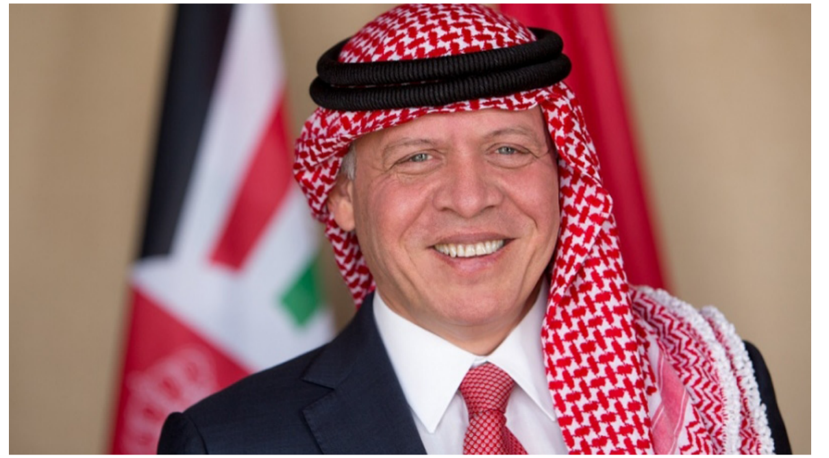
الانباط - العقبة

شارك جلالته الملك عبدالله الثاني في العقبة، أمس الخميس، بجولة جديدة من مبادرة «اجتماعات العقبة»، المنعقدة للمرة الأولى حول دول أمريكا اللاتينية، والتي تم تنظيمها بالشراكة مع البرازيل، وبحثت الجولة، التي حضرها سمو