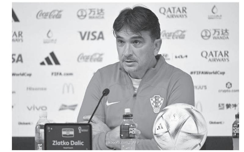
الدوحة - وكالات

رد زلاتكو داليتش المدير الفني لمنتخب كرواتيا، على تصريحات وليد الركراكي المدير الفني لمنتخب المغرب، بشأن أحلام أسود الأطلس بالذهاب بعيدا في كأس العالم والتتويج باللقب، وقال زلاتكو في تصريحات للصحفيين، إن منتخب المغرب من حق أن يحلم بصعد لقب كأس العالم. وأضاف: "لماذا لا يفوز منتخب المغرب بالمونديال؟ أعتقد أن نفس الحلم عاشه المنتخب الكرواتي من قبل في النسخة الماضية واستطاع أن يصل للمباراة النهائية خمس أمام فرنسا،