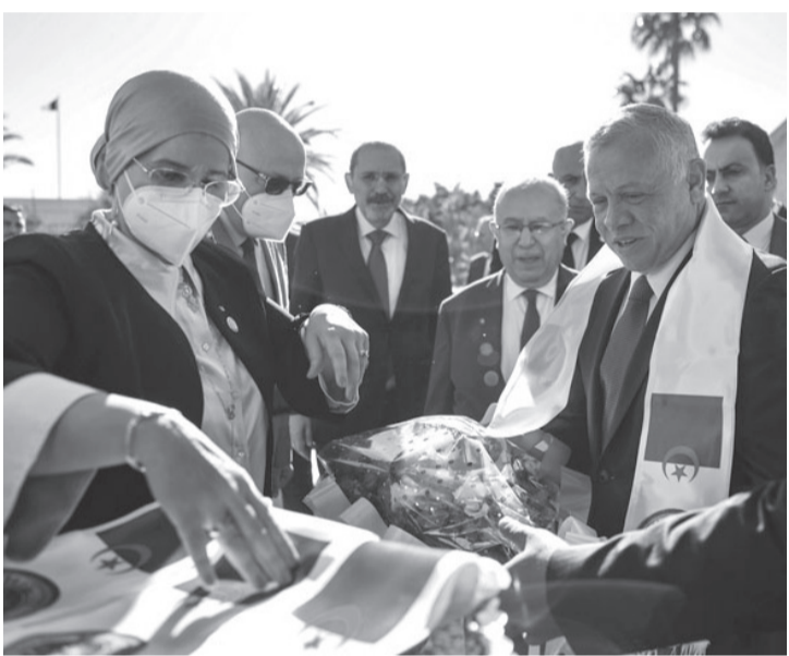
الانباط - الجزائر

إذ استمع جلالة الملك عبد الله الثاني، أمير الأردن، خلال زيارته للدولة التي يقوم بها إلى الجزائر مقام الشهيد والمتحف الوطني للمجاهد في هضبة «الحامة»، المطلّة على خليج الجزائر، قدام وزير الشؤون الخارجية والجالية الوطنية بالخارج رمضان لعمامرة، إيجازاً حول المدينة القديمة والميناء والمناطق المحيطة.