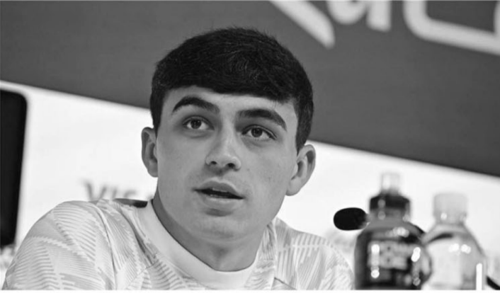
الدوحة - وكالات

ذلك يجعلني في أفضل حالاتي، وتابع "لجميع سيكون متحفزا أي لاعب سيكون مندفعاً ومتحفزاً ويبحث عن صناعة الفارق. نريد أن نجعل إسبانيا بطلة العالم مجدداً.. وتحدث عن منتخب المغرب بقوله "منتخب المغرب قدم مستويات رائعة في دور المجموعات، وأثبت قوته، وزاد قانلاً "لهم لا يتوقفون عن الركض طوال الـ ٩٠ دقائق، وهذا أمر لفت انتباهنا، كما يمتلكون المهارات، وبإمكان المغرب أن ينافسنا في أي لحظة.. وواصل "نحن الآن في مراحل خروج المغلوب، لذلك علينا أن نحسن تركيزنا لمواصلة المشوار في هذه البطولة.. واستطرد "كل اللاعبين اعتادوا اللعب وسط أعداد غفيرة من الجماهير تهتفت ضدنا، أحب مواجهة هذا النوع من الضغط، المغرب يريد أن يفوز، وبدينا يجب أن نخلق فرص التأهل إلى ربع النهائي.."