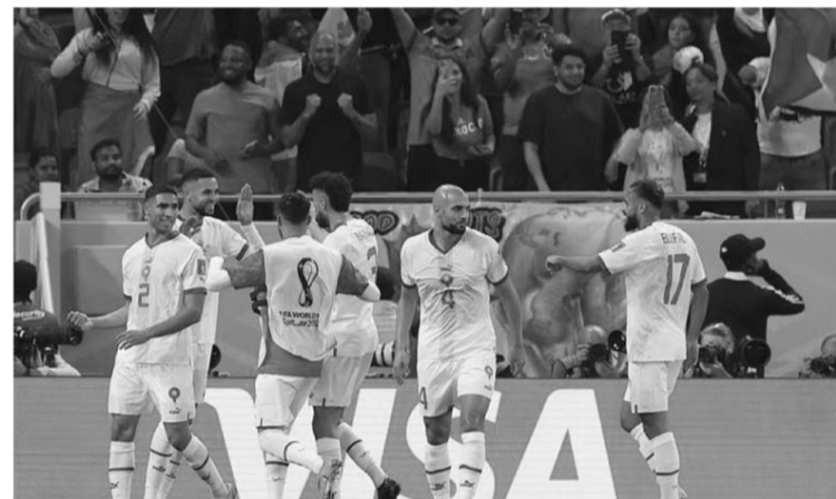
الدوحة - وكالات

مهاجم إشبيلية الإسباني، وزميله في الفريق الأندلسي، الحارس ياسين بونو، اللذين لن تكون مواجهة نجوم إسبانيا بالغبية عليهما. وأكد الكراكي أن منتخب المغرب سيدخل مواجهة إسبانيا من أجل اقتناص ورقة الترشح لدور الثمانية في المونديال، مضيفاً: "منتخب إسبانيا يمتلك قدرات عالية على المستويين الفردي والجماعي، وقادر على امتلاك الكرة بشكل كبير، لكننا سنحاول اللعب بالقيام التي نمتاز بها لتحقيق أفضل النتائج.. من جانبه، تخطى منتخب إسبانيا، الذي يشارك في المونديال للمرة الـ ١٦ في تاريخه، الدور الأول في كأس العالم للمرة الـ ١١، بعدما حصل على المركز الثاني في ترتيب المجموعة الخامسة، عقب حصده ٤ نقاط، إثر تحقيقه انتصاراً وحيداً وتعادلاً واحداً، وخسر في مباراة واحدة.. من جانبه، يرى بيدري، نجم منتخب إسبانيا الشاب أن الهزيمة أمام اليابان كانت بمثابة جرس إنذار للفريق قبل مواجهة المنتخب المغربي، حيث قال لصحيفة (سبورت) الكتالونية: "لقد أدرنا أن كل اللقاءات مسألة حياة وموت، المباراة الأخيرة كانت صعبة للغاية، لم تكن نتوقع تلك النتيجة أمام اليابان.. وأضاف بيدري "لحسن الحظ مازالت لدينا فرصة أخرى، لكننا إذا فقدنا أسلوبنا لمدة ١٠ دقائق، كنا سنخاطر بالبطولة، لو كانوا سجلوا أهدافاً، لرُبما كان ذلك الشيء الوحيد الذي يحتاجونه.."