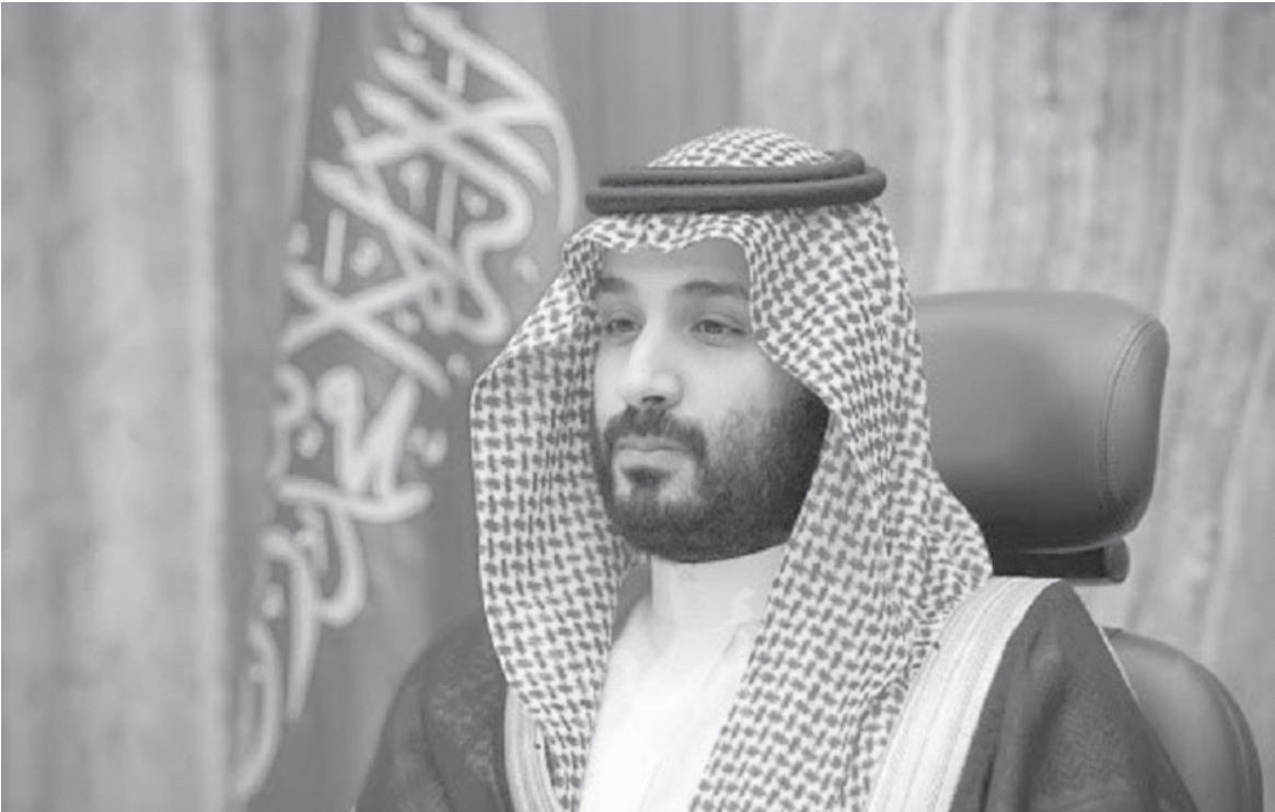
الانباط – وكالات

عقب القمة الخليجية – الصينية في الرياض يوم الجمعة، أن جهود الأمير محمد بن سلمان واضحة في الوساطة بشأن الإفراج وتبادل مسجونين بين أمريكا وروسيا. وأوضح: ” بالنسبة للوساطة، أنا مطلع على جهود ولي العهد في الوساطة وقد نجح في مرحلة سابقة في العملية