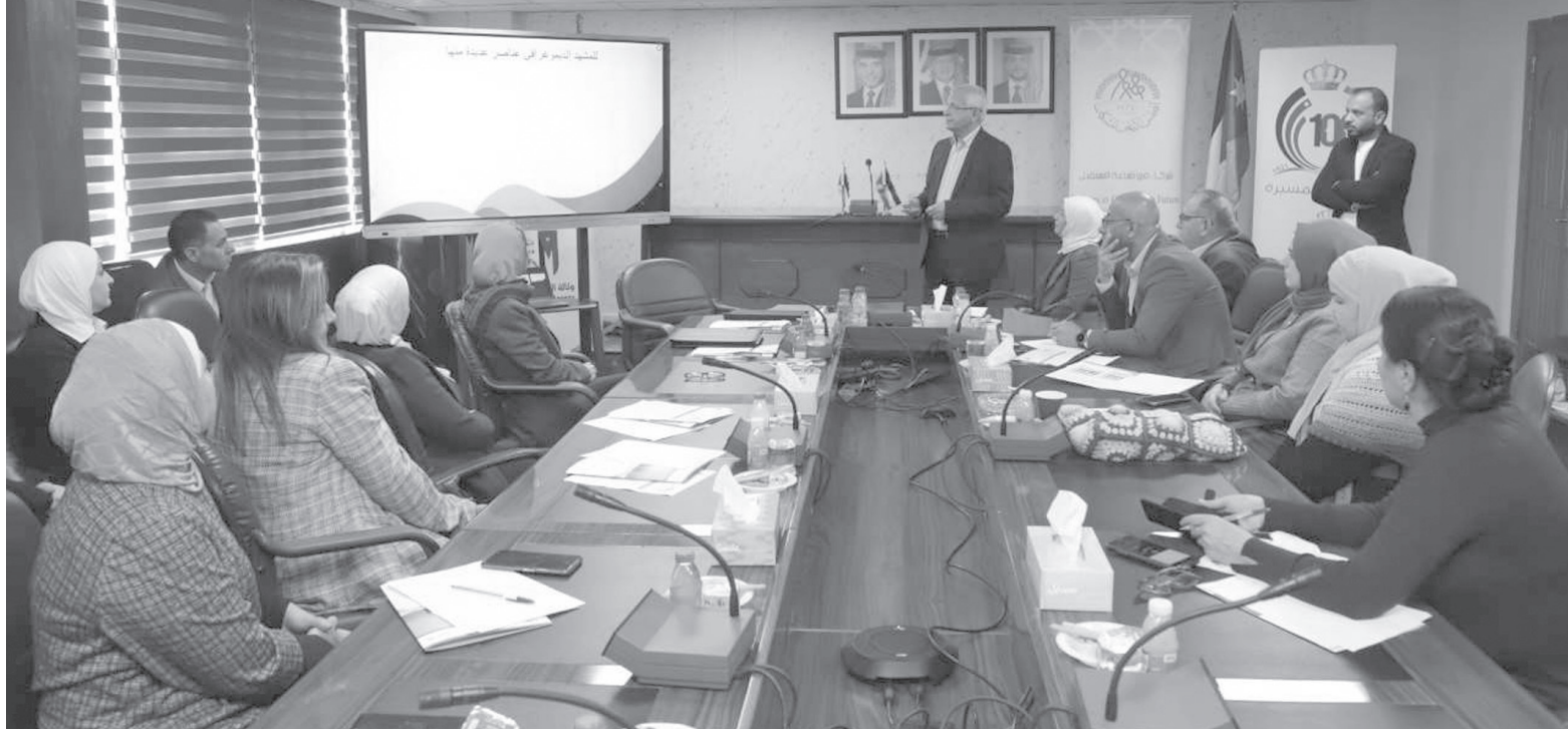
الإنباط – عمان

من السكان في شمال غرب المملكة؛ ما يشكل فيضانا حضريا ضارا بالأراضي الزراعية والريفية، والمحميات البيئية والطبيعية، وينعكس سلبيا أيضا على الغطاء النباتي، ويشكل تحديا للأمن الغذائي، وعيما إضافيا على البنية التحتية والخدمات العامة.