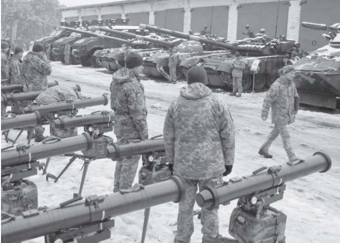
الانباط – وكالات

أمر صعب للغاية. كما هو الأمر نفسه مع ملايين الأسلحة الصغيرة والأسلحة الخفيفة، إذ من المستحيل تماما مراقبتها، لأن القتال لا يسمح لواشنطن بإرسال خبراءها إلى الميدان لمراقبة الأسلحة