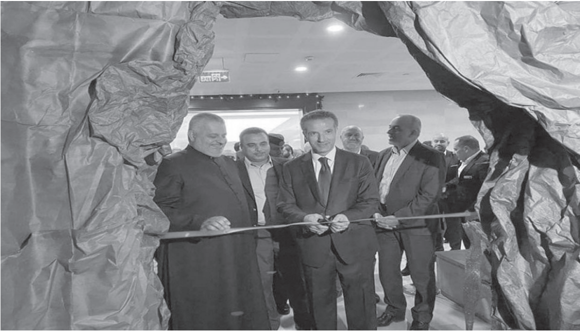
الإنباط – البحر الميت

افتتح وزير السياحة والآثار العامة نايف الفايز، مساء الجمعة، مغارة الميلاد في فندق البحر الميت العلاجي. وتأتي مغارة الميلاد الأكبر في الأردن كنموذج ومجسم يُحاكي ميلاد المسيح عيسى بن مريم، كما تكتسب أهميتها كونها الوحيدة في منطقة البحر الميت السياحية والدينية وضمن الأراضي المقدسة، وأيضاً كونها تقع في جوار موقع المغلس ”المعدانية“ الذي يتم العمل على تطويره.