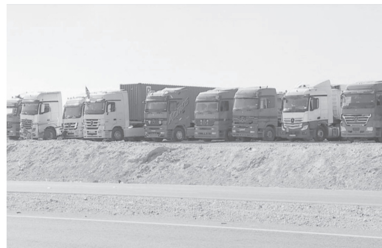
الانباط- سبأ السكر

ومن الواضح أمام الجميع أن حالة من الاحتقان تسود غالبية اعضاء مجلس النواب اثر ردة فعل رئيس الوزراء على تعليقاتهم على قرار رفع الاسعار، الأمر يدعونا للترجيح بان مشهد جلسة المناقشة التي تم تأجيلها سيكون أشبه بـ "معركة داحس والغبراء"، حيث سيستثمر كل نائب المناسبة ويصعب غضبه على الحكومة.