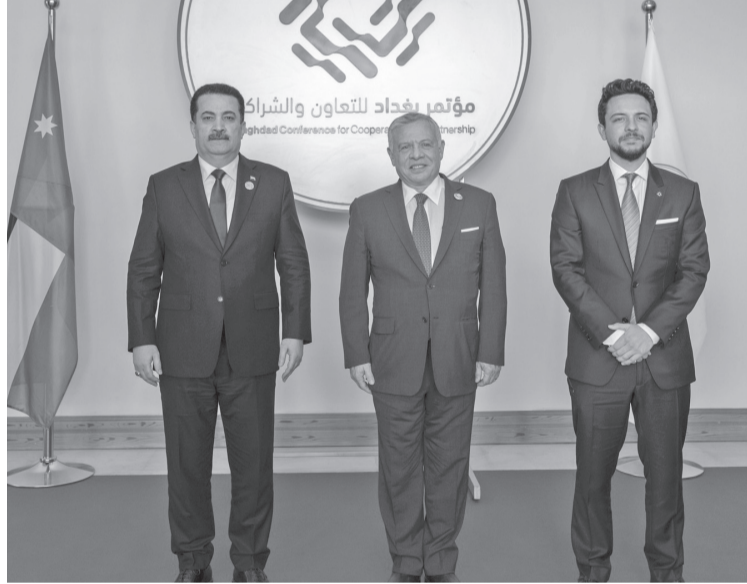
الأعلى للشؤون الخارجية والسياسة الأمنية جوزيب بوريل. وأكد جلالته الملك، خلال اللقاء الذي عقد على هامش انعقاد الدورة الثانية لمؤتمر

بغداد للتعاون والشراكة، متانة العلاقات بين المملكة والاتحاد الأوروبي. ولفت جلالته إلى أهمية تعزيز التعاون مع الاتحاد الأوروبي وفتح آفاق جديدة للشراكة، لتوسيع التشبيك والتواصل بين دول المنطقة والدول الأوروبية، بما يخدم المصالح المشتركة. وتناول اللقاء الدعم الذي يقدمه الاتحاد الأوروبي للمملكة في المجالات التنموية. وأكد نائب رئيس المفوضية الأوروبية أهمية دور الأردن في المنطقة، مشيدا بعمق الشراكة بين الاتحاد الأوروبي والمملكة. كما أعرب بوريل عن تعازيه لجلالة الملك في شهادته الواجب من مديرية الأمن العام. وأكد جلالته الملك خلال لقائه الممثلة الخاصة للأمن العام للأمم المتحدة في العراق جنين هينيس- بلاسخرت ضرورة بذل كل الجهود لدعم مسيرة التنمية والازدهار في العراق.