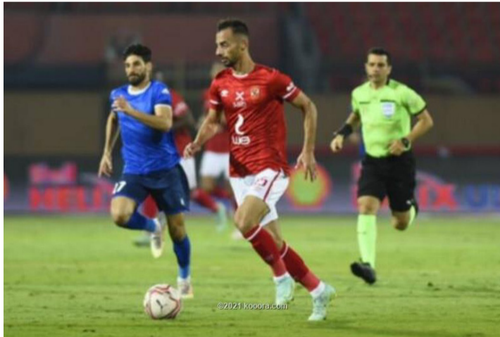
القاهرة - وكالات